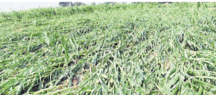
అకాల వర్షాలికి నెలకొలిగిన మొక్కజొన్న పంట

జిల్లాలోని మంచాల, యాచారం, మాడ్లూ, ఆమనగల్లు, షాద్ నగర్, కొత్తూరు, కొండుర్లు, కేశంపేట, చౌదరిగూడ, షాబాద్ వంటి మండలాల్లో భూగర్భజలాలు అడుగుంటున్నాయి. నీరు అందక వరి, మొక్కజొన్న, ఉల్లిగడ్డ, మిర్చి తదితర పంటలు పెద్దఎత్తున ఎండిపోయాయి. జిల్లాలో 93,000 ఎకరాల్లో రైతులు వరి పంటను సాగు చేయగా.. సుమారు 15,000 ఎకరాల వరకు ఎండిపోయినట్లు సమాచారం. ఉన్న పంటను కాపాడుకునేందుకు రైతులు అప్పులు చేసి కొత్త బోర్లను తవ్వగొట్టే పాటు బ్యాంకర్ల ద్వారా నీరందిస్తున్నారు. తీరా.. చేతికందే సమయంలో అతివృష్టితో తీవ్ర నష్టం కలిగింది. అలాగే, జిల్లాలో