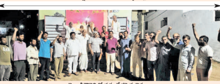
మొండిగొర్రెల్లో సమావేశమైన రైతులు