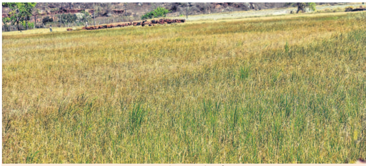
మంచాల మండలం బిళ్లపూర్ సమీపంలో నీళ్లులేక ఎండిపోయిన వరి పంట