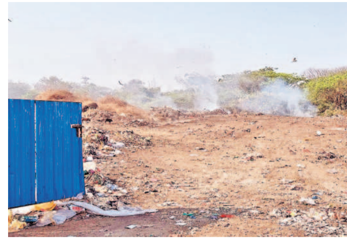
భిల్ లోని చెత్త డంపింగ్ యార్డ్ లో మంటలు వెదజల్లుతున్న పాగ

జీవిత తెలియని అనుభూతిని పొందుతారు. కానీ ఇదంతా మొన్నటి వరకు భిల్ లో ఉన్న పరిస్థితి. ఇప్పుడు భిల్ లో ఎక్కడ చూసినా చెత్తాచెదారం కనిపిస్తుంది. పొద్దులు మొయిం టనెన్స్ లేదు, పారిశుధ్య సమస్యలు ఇలా చెప్పుకుంటూ పోతే గతంలో భిల్ లో ఉన్న వాతావరణం ఇప్పుడు లేదని చెప్పుకోవచ్చు. భిల్ సంబంధిత అధికారుల పర్యవేక్షణ లోపమా? నిర్లక్ష్యమా? అనే సందేహాలు వ్యక్త మవుతున్నాయి. భిల్ పరిసరాల్లో గతంలో మాదిరిగా ఇప్పుడు మొయిం టనెన్స్ ఏమాత్రం ఉండటంలేదని ప్రకృతి ప్రేమికులు, స్థానికులు అభిప్రాయపడుతున్నారు. వెంటనే భిల్ ఈడీ స్పందించి సమస్యలను పరిష్కరించాలని స్థానికులు డిమాండ్ చేస్తున్నారు.