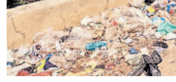
రోడ్డు పక్కన పేరుకుపోయిన చెత్తాచెదారం, ప్లాస్టిక్ కవర్లు

భిల్ ముందుగా ఆర్టిపురం, పటాన్చెరుకు వెళ్లే వారు చందానగర్, లింగంపల్లి వరకు మొయిం నోట్లపై వచ్చి అక్కడి నుంచి బీహెచ్ ఈఎల్ కానీ అధికారుల నిర్లక్ష్యంతో వర్షావరణానికి లోకీ ప్రవేశించి పచ్చటి అందాన్ని, స్వచ్ఛమైన వాతావరణం కలుగుతుంది. భిల్ లో చెత్త డంపింగ్ యార్డు వాయు కాలుష్యం పెరుగుతుంది.