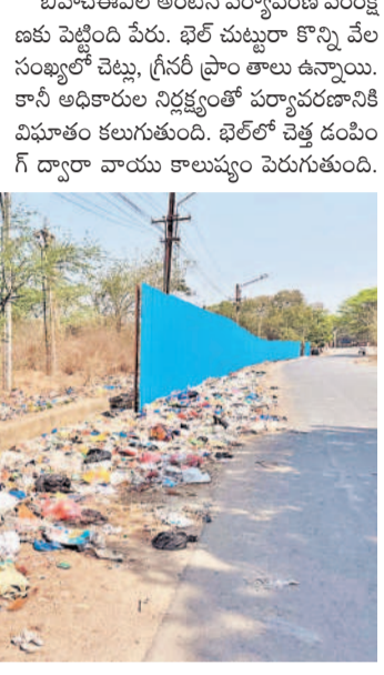
రోడ్డు పక్కన పేరుకుపోయిన చెత్తాచెదారం, ప్లాస్టిక్ కవర్లు

రామచంద్రాపురం, మార్చి 23 : బీహెచ్ ఈఎల్ అంటేనే పచ్చదనం, స్వచ్ఛమైన గాలి, చక్కటి వాతావరణం. ఇలాంటి ప్రకృతి ప్రేమికులు వాతావరణం హైదరాబాద్ కి దగ్గర్లో మనకు ఎక్కడ దొరకదని చెప్పుకోవచ్చు. ట్రాఫిక్ లో ఉక్కిరిబిక్కిరయ్యే వాహనదారులకు భిల్ పరిసరాల్లోకి రాగానే ఏదో తెలియని ప్రకృతి ప్రేమికులు ఆర్టిపురం, పటాన్చెరుకు వెళ్లే వారు చందానగర్, లింగంపల్లి వరకు మొయిం నోట్లపై వచ్చి అక్కడి నుంచి బీహెచ్ ఈఎల్ కానీ అధికారుల నిర్లక్ష్యంతో వర్షావరణానికి లోకీ ప్రవేశించి పచ్చటి అందాన్ని, స్వచ్ఛమైన వాతావరణం కలుగుతుంది. భిల్ లో చెత్త డంపింగ్ యార్డు వాయు కాలుష్యం పెరుగుతుంది.