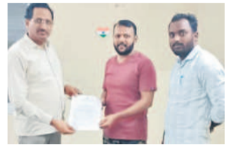
ఎల్ ఆర్ ఎస్ ఫీజు చెల్లించిన వారికి ప్రాసీడింగ్ పత్రాలు అందజేస్తున్న కమిషనర్

జిన్నారం మార్చి 23 : ఎల్ ఆర్ ఎస్ 25 శాతం ఫీజు రాయితీతో ప్రజలకు ఎంతో ప్రయోజనం కలుగుతుందని బోల్లారం మున్సిపల్ కమిషనర్ మధుసూదన్ రెడ్డి అన్నారు. ఆదివారం ఎల్ ఆర్ ఎస్ పథకంలో భాగంగా ఆన్ లైన్ లో ఫీజు చెల్లించిన లబ్ధిదారులకు కమిషనర్ ప్రాసీడింగ్ క్రమబద్ధీకరణ పత్రాలను అందజేశారు. ప్రభుత్వ నిబంధనల ప్రకారం ఫీజు చెల్లించిన వారికి ప్రాసీడింగ్ పత్రాలను అందజేస్తున్నారు. మార్చి 31లోగా రిజిస్ట్రేషన్లు పూర్తి చేసుకున్నవారికి ఎల్ ఆర్ ఎస్ ఫీజులో రాయితీ వర్తిస్తుందని, ప్రభుత్వం కల్పించిన ఈ అవకాశాన్ని సద్వినియోగం చేసుకోవాలని దరఖాస్తుదారులను కోరా