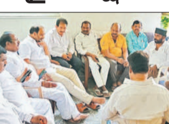
సమావేశంలో మాట్లాడుతున్న జిఆర్ ఎస్ నాయకులు అధ్యక్షులు

రామచంద్రాపురం, మార్చి 23 : రామచంద్రాపురం పట్టణంలోని ఈడాలో ఈనెల 27న ఇష్టానుగుణంగా పండుగలు జరుపుకోవాలి