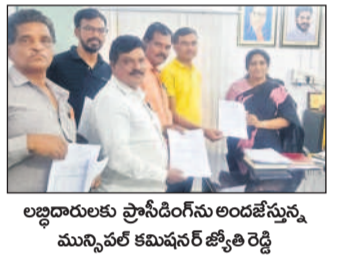
లబ్ధిదారులకు ప్రాసీడింగ్ అందజేస్తున్న మున్సిపల్ కమిషనర్ జ్యోతి రెడ్డి

అమీన్ పూర్తి, మార్చి 23 : అమీన్ పూర్తి మున్సిపల్ పరిషత్ ఇప్పటివరకు 88 మంది ఎల్ ఆర్ ఎస్ లబ్ధిదారులకు ప్రాసీడింగ్ అందించినట్లు కమిషనర్ జ్యోతి రెడ్డి తెలిపారు. సుమారు రూ. ఐదు కోట్ల ఆదాయం సమకూరినట్లు తెలిపారు. ఆదివారం ఒక రోజు 58 మందికి ప్రాసీడింగ్ అందజేసినట్లు తెలిపారు. తమ పరిషత్ ఎల్ ఆర్ ఎస్ ప్రక్రియ ప్రారంభమైన నాటి నుంచి 8 వేల దరఖాస్తులు వచ్చాయని తెలిపారు.