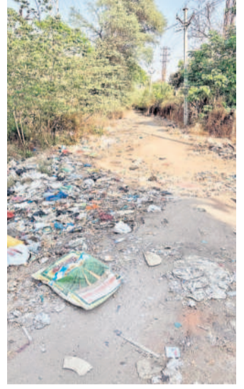
భిల్ లో అపరిశుభ్రంగా మారిన రోడ్డు మార్గం

భిల్ ముందుగా ఆర్టిపురం, పటాన్చెరుకు వెళ్లే వారు చందానగర్, లింగంపల్లి వరకు మొయిం నోట్లపై వచ్చి అక్కడి నుంచి బీహెచ్ ఈఎల్ కానీ అధికారుల నిర్లక్ష్యంతో వర్షావరణానికి లోకీ ప్రవేశించి పచ్చటి అందాన్ని, స్వచ్ఛమైన వాతావరణం కలుగుతుంది. భిల్ లో చెత్త డంపింగ్ యార్డు వాయు కాలుష్యం పెరుగుతుంది.