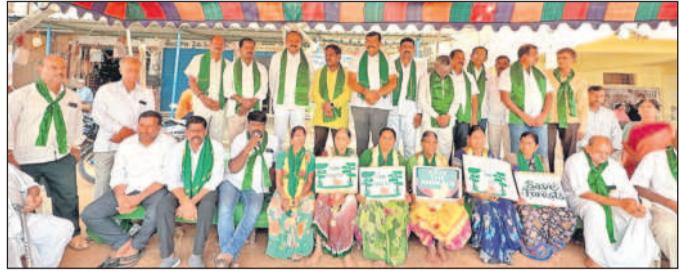
రిలే నిరాహారదీక్షకు సంఘీభావం తెలుపుతున్న రైతు జేఏసీ నాయకులు