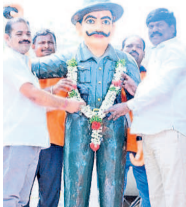
భానాపురం: ధర్మారావుపేటలో భగత్ సింగ్ చిత్రపటానికి పూలమాల వేస్తున్న పద్మి