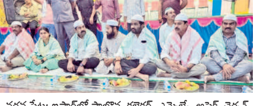
వర్ధన్లుపేట: ఇఫ్తార్లో పాల్గొన్న కలెక్టర్, ఎమ్మెల్యే, అసెస్సెంట్ కలెక్టర్

పన్ను పనులపై ముందస్తు ప్రణాళిక చేయడంలో బిల్డియా అధికారులు విఫలమయ్యారు. ఏలా పన్ను పనులకు లక్ష్యం ముందే ఉంటుంది. దాన్ని చివరి రెండు నెలలలో హడావుడి చేసి టార్గెట్లపై విధించడం కంటే ముందే ఏడాది పన్నుల లక్ష్యాన్ని చేరుకోవడంపై కార్యాచరణ రూపొందించాలని అధికారులు దృష్టి పెట్టడం లేదు. ఏడాదిలో పన్ను పనులకు లక్ష్యాన్ని మూడు నెలల చొప్పున విభజించి టార్గెట్లపై పన్ను పనులకు కట్టడం చేయడం సులభంగా ఉండేది. అలా చేయకుండా రెండు నెలల నుంచి టార్గెట్లపై విధించడంతో ఉద్యోగులు సతమతమవుతున్నారు. టార్గెట్లపై వణికిపోతున్న ఉద్యోగులకు మిగిలిన 8 రోజులే.