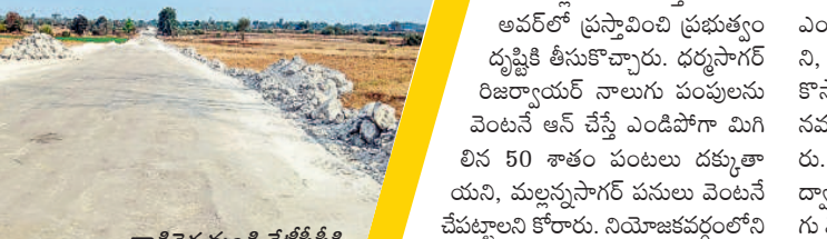
తాడిచెర్ల నుండి కేటీపీపీకి నిర్మిస్తున్న రోడ్డు

తాడిచెర్ల ఓసీ నుంచి 7 వేల టన్నులు, భూపాలపల్లి గుండు నుంచి 6 వేల టన్నుల బోగ్ రవాణా వందలాది లారీల్లో కేటీపీపీకి రవాణా అవుతున్నది. ఈ క్రమంలో ధన్య, వాహన కాలుష్యంతో పర్యావరణం దెబ్బ తింటున్నది. దీనికి తోడు లారీల ద్వారా బోగ్ రవాణాకు ప్రతిరోజూ రూ. 2 నుంచి రూ. 3 కోట్ల ఖర్చువుతున్నది అధికారులు చెబుతున్నారు. కన్వేయర్ బెల్ట్ ద్వారా బోగ్ రవాణా జరిగితే ఖర్చు తగ్గడమే కాకుండా పర్యావరణం కూడా దెబ్బ తినకుండా ఉంటుందని వారు పేర్కొంటున్నారు.