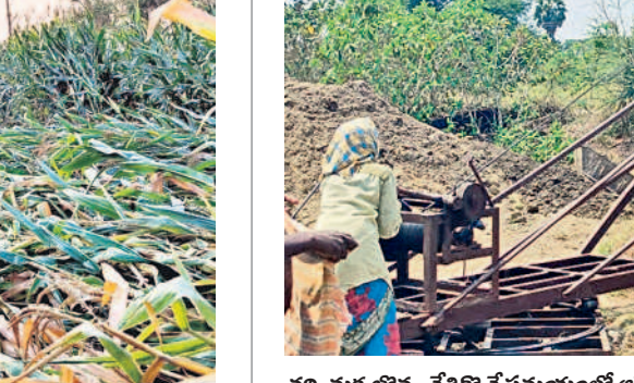
వరి, మక్కజొన్న చేతికొచ్చే సమయంలో ఆకలి వాగులో నీరు అడుగంటి పంటలు ఎండిపోతున్నాయి. నల్లొంబాపేట మండలంలోని గోలేబోడ్డుతండా తీసి పల్లెలోని దూకుండా, పల్లెతండా, నల్లొంబా పురం బంజెర రైతులు ఎండిపోయిన వేలను పశువులకు మేతగా వదిలేశారు. ఎస్సారెస్సీ, నీళ్ల కోసం రూ. 50వేల వరకు ఖర్చుచేసినా చుక్క నీరు రాకపోగా ఎండిన బాబుల్లో పూడి తీసినా ఫలితం లేకపోవడంతో పెద్దలడి కూడా రాదేమోనని ఆందోహం చెందుతున్నారు.