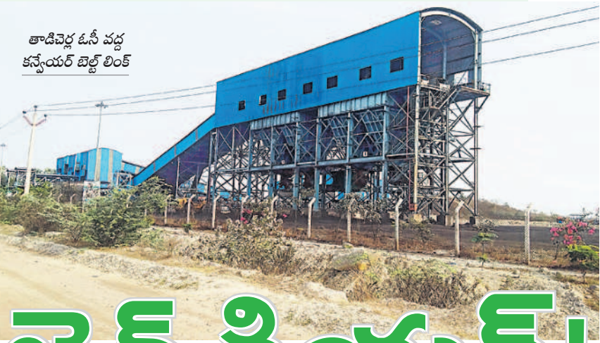
తాడిచెర్ల ఓసీ వద్ద కన్వేయర్ బెల్ట్ లింక్