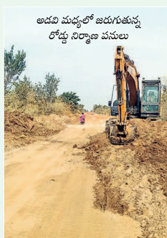
అడవి మధ్యలో జరుగుతున్న రోడ్డు నిర్మాణ పనులు

తాడిచెర్ల ఓసీ నుంచి కేటీపీపీకి చరకు కన్వేయర్ బెల్ట్ పనులు వచ్చే ఏడాది చివరి కల్లా పూర్తి చేసేందుకు అధికారులు ఏర్పాట్లు చేస్తున్నారు. తాడిచెర్ల నుంచి అటవీ ప్రాంతం గుండా కాశీపేట వరకు, జంగండు శివారు, సీపల్లి, కొంపెల్లి మీదుగా కేటీపీపీ వరకు బెల్ట్ నిర్మాణం జరగనుంది. అటవీశాఖ అనుమతులు సైతం రావడంతో రోడ్డు పనులు చక్కగా జరుగుతున్నాయి. కేవలం కొంపెల్లి, సీపల్లి గ్రామాల సమీపంలో 3.5 కిలోమీటర్ల పరిధిలో కొన్ని పంటలు ఉండడంతో రైతులు కొంత సమయం అడుగుతున్నారు. మిగిలిన రోడ్డు పనులు దాదాపుగా పూర్తయ్యాయి. దీంతో జయ శంకర్ భూపాలపల్లి-పెద్దపల్లి జిల్లా మధ్య రవాణా సౌకర్యం మెరుగుపడనుంది.