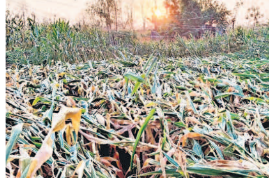
అకాల వర్షం అన్నదాతలను ఆగం చేస్తున్నది. సోమవారం సాయంత్రం ఈయంతులు లతో వాన వడి మహాబాబాబాద్ జిల్లా బయ్యారం మండలంలో బీరేని, మదవ గ్రామాల్లో మక్కజొన్న నేలవారింది. వలుచోట్ల విద్యుత్ స్తంభాలు విరిగి పడ్డాయి.