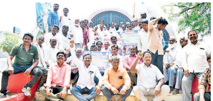
హనుమకొండ జిల్లా పరకాలలోని అమరధామంలో నివాదాలు చేస్తున్న ఉద్యమకారులు

జనగామ చౌరస్తా, మార్చి 24 : జనగామ జిల్లా కేంద్రం నడిబొడ్డున ఉన్న ధర్మకంఠ ప్రభుత్వ ఎస్సీ వన తిగ్గహంలో అధికారుల పర్యవేక్షణ లోపంతో విద్యార్థులు అశాస్త్రాభ్యాసం వ్యవహరిస్తున్నారు. హాస్టల్ లో చదువుకొన్న 9వ తరగతి విద్యార్థులు సోమవారం జూనియర్ డిపార్టుమెంట్ వేకాడుతూ స్థానికలకు కనిపించడంతో వారు మీడియాకు సమాచారమందించారు. ఆ సమయంలో విద్యలో ఉండాలన్న వ్యక్తుల వారైన అందుబాటులో లేదని తెలిసింది. పిల్లల్ని ఇంటి దగ్గర చదివించడానికి అధిక సౌకర్యం లేని నిరుపేద తల్లిదండ్రులు గంభీరంగా ప్రభుత్వ వనతి గృహంలో చదివిస్తుంటే అధికారులు క్రమశిక్షణ తప్పకుండా పాటించాలి. భావిభారత పౌరులుగా ఎడగాల్సిన పిల్లలు పెడదోవ పడుతుండడం ఆందోహం కలిగిస్తోంది. వనతి గృహంలో నిద్రకట్టగా వ్యవహరిస్తున్న సంబంధిత అధికారులపై చర్యలు తీసుకోవాలని తల్లిదండ్రులు కోరుతున్నారు. ఈ ఘటనపై సమగ్ర విచారణ జరపాలని దళిత, గిరిజన, విద్యార్థి సంఘాల నాయకులు డిమాండ్ చేస్తున్నారు.