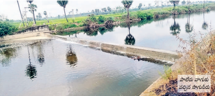
పాలేరు వాగుకు వచ్చిన సాగునీరు