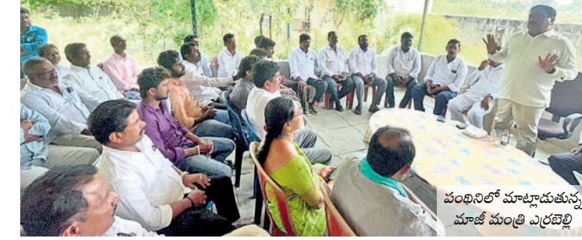
పంథినిలో మాట్లాడుతున్న మాజీ మంత్రి ఎర్రబెల్లి

తాగునీటికి అల్లాడుతున్న గొత్తికోయలు ఉన్న ఒక్కబోరు ద్వారా వస్తున్న మంగళవేల మండల కేంద్ర సమీప అటవీ ప్రాంతంలోని శాంతినగర్, పోచమ్మగూడెం గొత్తికోయలకు చెలిమి నీరే దిక్కుయ్యింది. అడవులోని తోగులు, కాల్వలు ఎండిపోవడంతో సుమారు యాభై కుటుంబాలు నీటి కోసం గోస పడుతున్నాయి. శాంతినగర్ గూడెంలో కలుషిత నీటిని తాగి అనారోగ్యం బాధించి పడుతున్నారు. పోచమ్మగూడెం సమీపంలోని గౌరాల వాగుకు వెళ్లి చెలిమిలు తప్పి నీళ్లు తెచ్చుకుంటున్నారు. తాగు నీటి కోసం అల్లాడుతుంటే అధికారులవరకు పట్టించుకోవడం లేదని వాపోతున్నారు. ఇప్పటికైనా నీటి గోస పడుతున్నాయి. శాంతినగర్ గూడెంలో