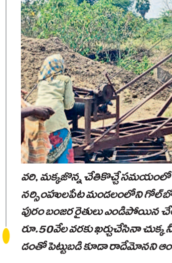
- నర్సింహపేట, మార్చి 24

వరి, మక్కజొన్న చేతికొచ్చే సమయంలో ఆకలి వాగులో నీరు అడుగంటి పంటలు ఎండిపోతున్నాయి. నర్సింహపేట మండలంలోని గోల్ బోడ్డుతండా తీసి పంథిలోని దూకంపల్లె, పల్లె తండా, నర్సింహ పురం వరకు రైతులు ఎండిపోయిన వేలను పశువులకు మేతగా వదిలేశారు. ఎస్సారెస్సీ నీళ్లు కోసం దూ. 50వేల వరకు ఖర్చుచేసినా చుక్క నీరు రాకపోగా ఎండిన బావుల్లో పూడి తీసినా ఫలితం లేకపోవడంతో పెట్టుబడి కూడా రాదేమోనని ఆందోళన చెందుతున్నారు.