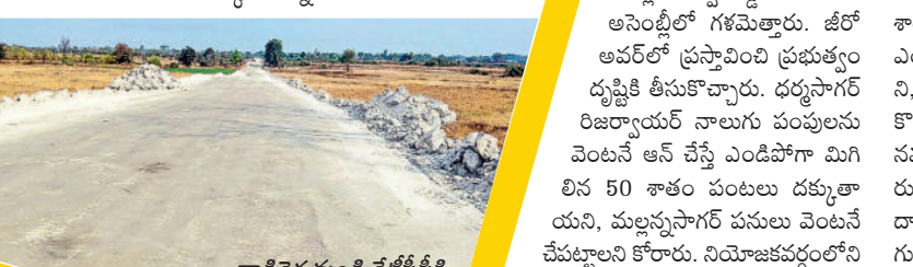
తాడిచెర్ల నుండి కేటీపీపీకి నిర్మిస్తున్న రోడ్డు

తాడిచెర్ల ఓసీ నుంచి 7 వేల టన్నులు, భూపాలపల్లి గుండు నుంచి 6 వేల టన్నుల బోగ్ ప్రతిరోజు వందలాది లారీల్లో కేటీపీపీకి రవాణా అవుతున్నది. ఈ క్రమంలో ధన్య, వాహన కాలుష్యంతో పర్యావరణం దెబ్బ తింటున్నది. దీనికి తోడు లారీల ద్వారా బోగ్ రవాణాకు ప్రతిరోజూ రూ. 2 నుంచి రూ. 3 కోట్ల ఖర్చువుతున్నది అధికారులు చెబుతున్నారు. కన్వేయర్ బెల్ట్ ద్వారా బోగ్ సరఫరా జరిగితే ఖర్చు తగ్గడమే కాకుండా పర్యావరణం కూడా దెబ్బ తినకుండా ఉంటుందని వారు పేర్కొంటున్నారు.