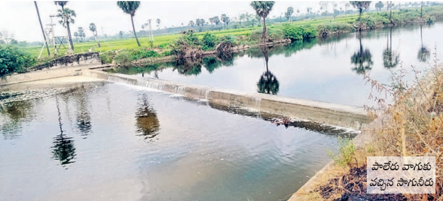
పాలేరు వాగుకు వచ్చిన సాగునీరు