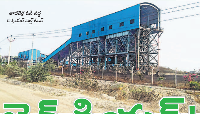
తాడిచెర్ల ఓసీ వద్ద కన్వేయర్ బెల్ట్ లింక్