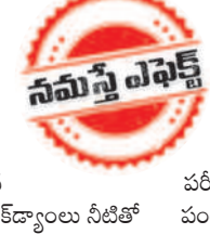
డీపీఎం 60 కాల్వ నుంచి విడుదల

కళకళలాడుతున్నాయి. పాలేరు వాగులోకి నీళ్లు చేరడంతో మహబూబాబాద్ జిల్లా దంతాలపల్లి మండలంలోని పరిమాహాళ రైతులు సంతోషంగా తమ పంటలకు పారింజుకుంటున్నారు.