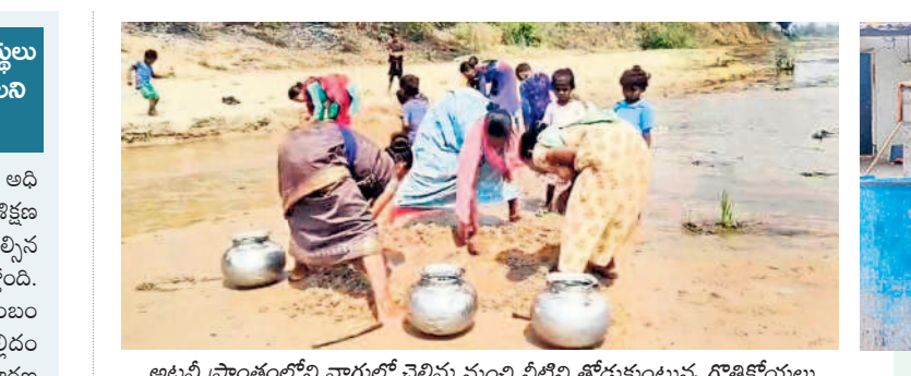
అటవీ ప్రాంతంలోని వాగులో చెలిమి నుంచి నీటిని తోడుకుంటున్న గొత్తికోయలు