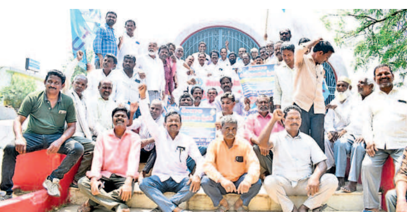
హనుమకొండ జిల్లా పరకాలలోని అమరధామంలో నివాదాలు చేస్తున్న ఉద్యమకారులు

దాకా ప్రభుత్వ పనుల గృహాల్లో చదివిస్తుంటే అధికారుల పట్టించుకోలేని తనంతో విద్యార్థులు క్రమశిక్షణ తప్పిస్తున్నారు. భావిభారత పౌరులుగా ఎదగాల్సిన పిల్లలు పెడదోవ పడుతుండడం ఆందోహం కలిగిస్తోంది. వసతి గృహంలో నిర్లక్ష్యంగా వ్యవహరిస్తున్న సంబంధిత అధికారులపై చర్యలు తీసుకోవాలని తల్లిదండ్రులు కోరుతున్నారు. ఈ ఘటనపై సమగ్ర విచారణ జరపాలని దళిత, గిరిజన, విద్యార్థి సంఘాల నాయకులు డిమాండ్ చేస్తున్నారు.