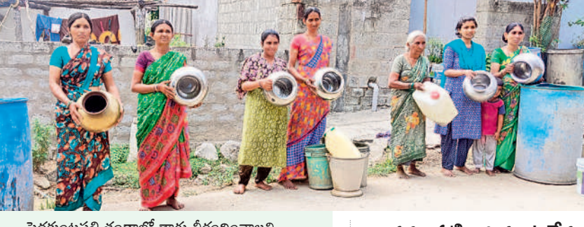
పెద్దకుంటపల్లి తండాలో తాగు నీరుందించాలని భాగ్య బిందెలతో ధర్మ చేస్తున్న మహిళలు