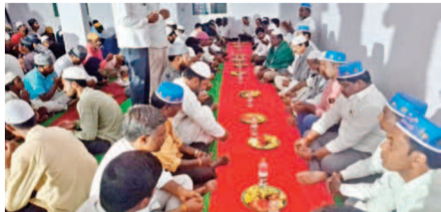
మునిపాలిలోని జమియీ మసీద్ వద్ద ముస్లింలకు రుణావసరం ఉన్నందుకు పురస్కారం పొందిన వారిని కృషి చేసిన మాజీ మంత్రి శీనన్న గారు.

నాయకులతో మాట్లాడుతున్న మాజీ మంత్రి శీనన్న గారు. ఆదివారం హైదరాబాద్ నుండి రూ. 50 లక్షల వరకు డబ్బులను మంత్రి శీనన్నకు సమర్పించారు.