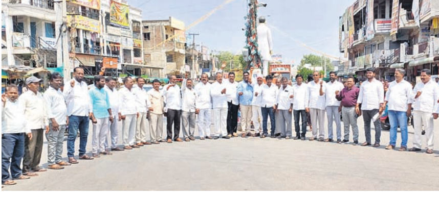
కొత్తకోటలో పెండింగ్ బిల్లుల కోసం ఆందోళన చేస్తున్న మాజీ సర్పంచులు