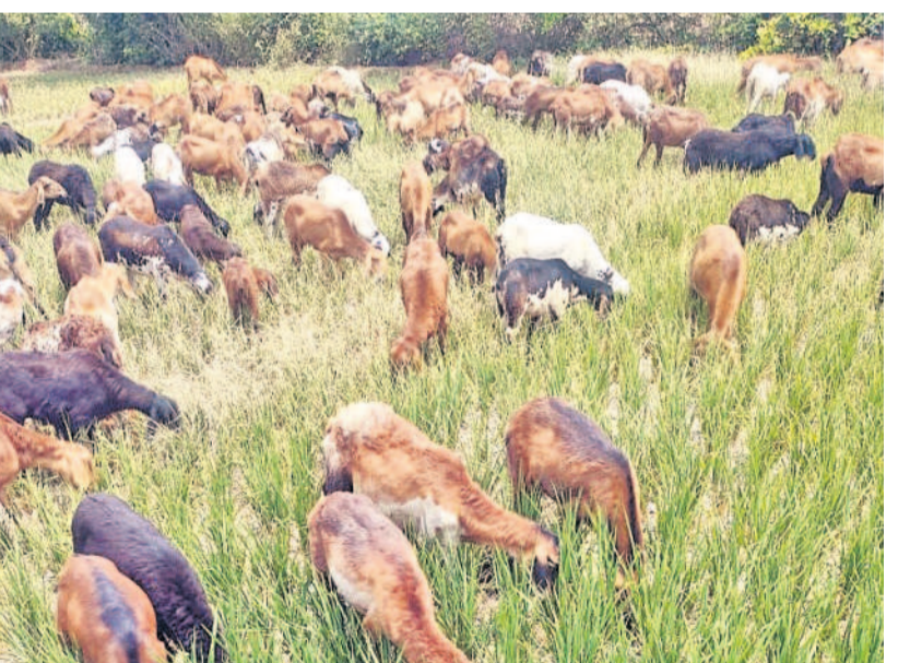
రంగారెడ్డి జిల్లా యాచారం మండలంలోని మేడిపల్లిలో ఎండిపోయిన పంటలను మేస్తున్న జీవాల

ఉమ్మడి రంగారెడ్డి జిల్లాలో కరువుచూపుతున్నాయి. సరిపడా వర్షాలు లేక భూగర్భ జలాలు అడుగుంటున్నాయి. ఇప్పటికే రంగారెడ్డి, వికారాబాద్ జిల్లాలోని పలు మండలాల్లోని చెరువులు, కుంటలు ఎండిపోయాయి. బోరుబావులు క్రమంగా వట్టిపోతున్నాయి. సరిపడా నీరందక పంటలూ ఎండిపోతున్నాయి. దీంతో చేసేదేమీ లేక అన్నదాతలు తమ పంటలను పశువులు, జీవాలకు మేతగా వేస్తున్నారు. ఆరు గాలం కష్టపడిన పంట చేతికొచ్చే దశలో కండ్ల ముందే ఎండిపోతుండడంతో వారు లబ్ధిబోమంటున్నారు.