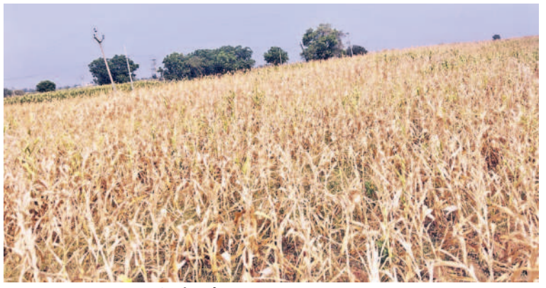
కేశంపేటలో ఎండిపోయిన మొక్కజొన్న పంట