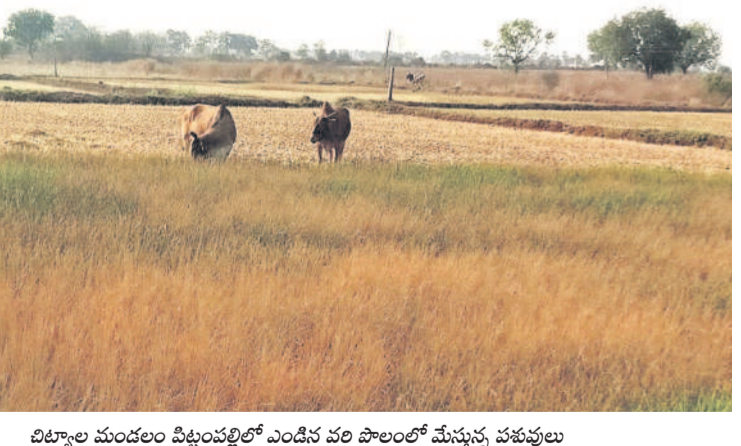
బిట్యాల మండలం పట్టణంలో ఎండం వల పొలంలో మేస్తున్న పశువులు