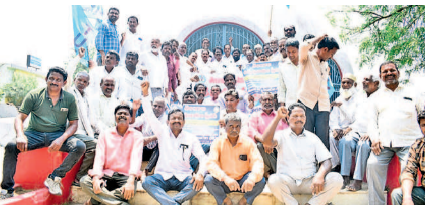
హనుమకొండ జిల్లా పరకాలలోని అమరధామంలో నివాదాలు చేస్తున్న ఉద్యమకారులు

డాక్టర్ ప్రభుత్వ వనతి గృహాల్లో చదివిస్తుంటే అధికారుల పట్టించుకోలేని తనతో విద్యార్థులు క్రమశిక్షణ తప్పిస్తున్నారు. భావిభారత పౌరులుగా ఎదగాల్సిన పిల్లలు పెడదొవ పడుతుండడం ఆందోహం కలిగిస్తోంది. వనతి గృహంలో నిద్రకట్టగా వ్యవహరిస్తున్న సంబంధిత అధికారులపై చర్యలు తీసుకోవాలని తల్లిదండ్రులు కోరుతున్నారు. ఈ ఘటనపై సమగ్ర విచారణ జరపాలని దశిత్, గిరిజన, విద్యార్థి సంఘాల నాయకులు డిమాండ్ చేస్తున్నారు.