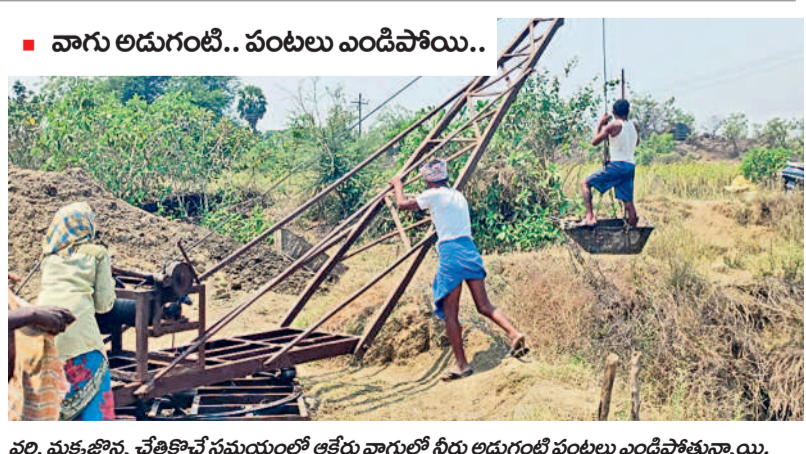
వరి, మక్కజొన్న చేతికొచ్చే సమయంలో ఆకలి వాగులో నీరు అడుగంటి పంటలు ఎండిపోతున్నాయి. నర్సింహపేట మండలంలోని గోలేబోడ్డు తండా జీపీ పల్లిలోని దూకం తండా, పల్లి తండా, నర్సింహ పురం బంజెర రైతులు ఎండిపోయిన వేలను పశువులకు మేతగా వదిలేశారు. ఎస్సారెస్సీ నీళ్లు కోసం రూ. 50వేల వరకు ఖర్చుచేసినా చుక్క నీరు రాకపోగా ఎండిన బావుల్లో పూడి తీసినా ఫలితం లేకపోవడంతో పెట్టుబడి కూడా రాదేమోనని ఆందోహం చెందుతున్నారు.