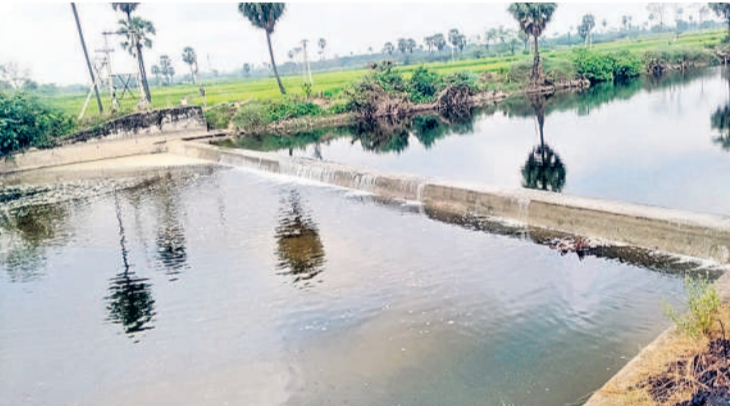
పాలేరు వాగుకు వచ్చిన సాగునీరు

కళకళలాడుతున్నాయి. పాలేరు వాగులోకి నీళ్లు చేరడంతో మహబూబాబాద్ జిల్లా దంతాలపల్లి మండలంలోని పరివాహక రైతులు సంతోషంగా తమ పంటలకు పారింజుకుంటున్నారు.