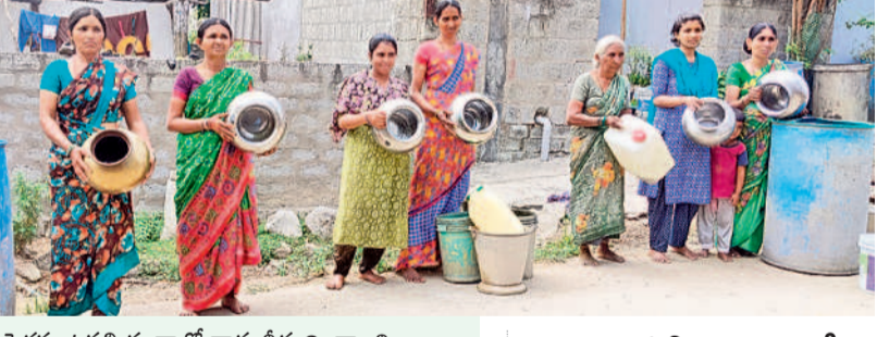
పెద్దకుంటపల్లి తండాలో తాగు నీరుందించాలని భాగ్య బిందెలతో ధర్మ చేస్తున్న మహిళలు

తాగునీటికి అల్లాడుతున్న గొత్తికోయలు ఉన్న ఒక్కబోరు ద్వారా వస్తున్న మంగళేటి మండల కేంద్ర సమీప అటవీ ప్రాంతంలోని శాంతినగర్, పోచమ్మగూడెం గొత్తికోయలకు చెలిమి నీరే దిక్కు ఉంది. అడవులోని తోగులు, కాల్వలు ఎండిపోవడంతో సుమారు యాభై కుటుంబాలు నీటి కోసం గోస పడుతున్నాయి. శాంతినగర్ గూడెంలో కలుషిత నీటిని తాగి అనారోగ్యం బాధించి పడుతున్నారు. పోచమ్మగూడెం సమీపంలోని గోరాచర్ల వాగుకు వెళ్లి చెలిమిలను తప్పి నీళ్లు తెచ్చుకుంటున్నారు. తాగు నీటి కోసం అల్లాడుతుంటే అధికారులవరకు పట్టించుకోవడం లేదని వాపోతున్నారు. ఇప్పటికైనా నీటి గోస పడుతున్నాయి. శాంతినగర్ గూడెంలో