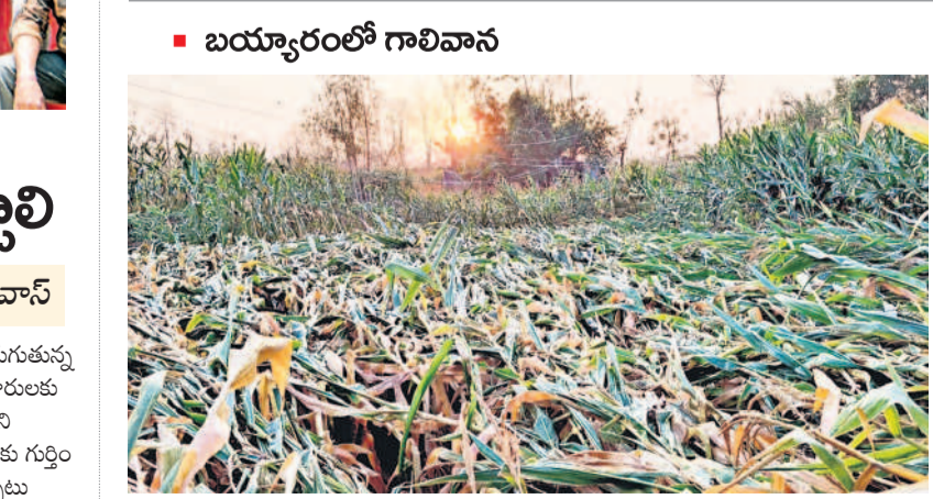
అకాల వర్షం అన్నదాతలను ఆగం చేస్తున్నది. సోమవారం సాయంత్రం ఈయం గాలులతో అనేక వరి మహాబాబాబాద్ జిల్లా బయ్యారం మండలంలో బీరేని, మదవ గ్రామాల్లో మక్కజొన్న నేలనాంది. వలుచోట్ల విద్యుత్ స్తంభాలు విరిగి పడ్డాయి.