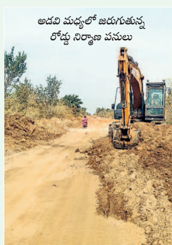
అడవి మధ్యలో జరుగుతున్న రోడ్డు నిర్మాణ పనులు

తాడిచెర్ల ఓసీ నుంచి కేటీపీపీకి చరకు కన్వేయర్ బెల్ట్ పనులు వచ్చే ఏడాది చివరి కల్లా పూర్తి చేసేందుకు అధికారులు ఏర్పాట్లు చేస్తున్నారు. తాడిచెర్ల నుంచి అటవీ ప్రాంతం గుండా కాశీపేటి శివారు, జంగేడు శివారు, సీపల్లి, కొంపెల్లి మీదుగా కేటీపీపీ వరకు బెల్ట్ నిర్మాణం జరుగుతుంది. అటవీశాఖ అనుమతులు సైతం రావడంతో రోడ్డు పనులు చక్కగా జరుగుతున్నాయి. కేవలం కొంపెల్లి, సీపల్లి గ్రామాల సమీపంలో 3.5 కిలోమీటర్ల పరిధిలో కొన్ని పంటలు ఉండడంతో రైతులు కొంత సమయం అడుగుతున్నారు. మిగిలిన రోడ్డు పనులు దాదాపుగా పూర్తయ్యాయి. దీంతో జయ శంకర్ భూపాలపల్లి-పెద్దపల్లి జిల్లా మధ్య రవాణా సౌకర్యం మెరుగుపడనుంది.