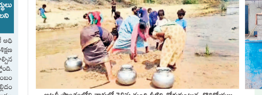
అటవీ ప్రాంతంలోని వాగులో చెలిమి నుంచి నీటిని తోడుకుంటున్న గొత్తికోయలు

అమ్మకాలు ఉంటాయని కలెక్టర్ పేర్కొన్నారు. రాష్ట్రస్థాయి రైతు ఉత్సవాలకు సంఘాల ఉత్సవం, స్టాల్లు, విజయాల, కేంద్ర, రాష్ట్ర ప్రభుత్వాల నుంచి పొంది వివిధ బ్యాంకు లింకేషన్ పథకాలు, నిష్పత్తులపై శాస్త్రవేత్త ద్వారా రైతులకు అవగాహన పంపిస్తూ సులభ వివరించారు. రైతులు పెద్ద సంఖ్యలో తరలివచ్చి కార్యక్రమాన్ని విజయవంతం చేయాలన్నారు. ఇక్కడ అదనపు కలెక్టర్ సందర్శనా, జిల్లా వ్యవసాయ అధికారి అనుసారం పోల్డారు.