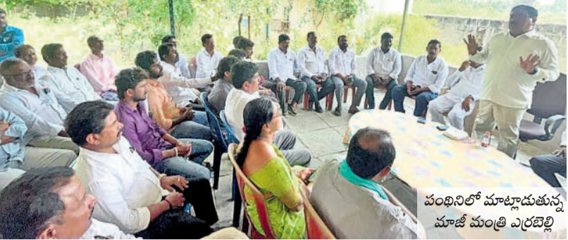
పంథినిలో మాట్లాడుతున్న మాజీ మంత్రి ఎర్రబెల్లి