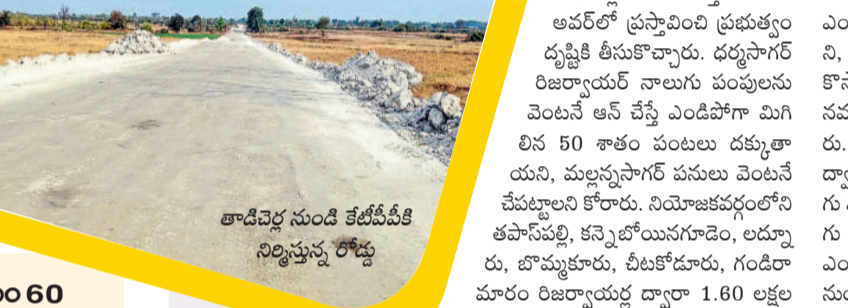
తాడిచెర్ల నుండి కేటీపీపీకి నిర్మిస్తున్న రోడ్డు

తాడిచెర్ల ఓసీ నుంచి 7 వేల టన్నులు, భూపాలపల్లి గుండు నుంచి 6 వేల టన్నుల బోగ్గూరు ప్రతిరోజు వందలాది లారీల్లో కేటీపీపీకి రవాణా అవుతున్నది. ఈ క్రమంలో ధ్వని, వాహన కాలుష్యంతో పర్యావరణం దెబ్బ తింటున్నది. దీనికి తోడు లారీలో ద్వారా బోగ్గూరు రవాణాకు ప్రతిరోజూ రూ. 2 నుంచి రూ. 3 కోట్ల ఖర్చువుతున్నది అధికారులు చెబుతున్నారు. కన్వేయర్ బెల్ట్ ద్వారా బోగ్గూరు నరసరాకు జరిగే ఖర్చు తగ్గడమే కాకుండా పర్యావరణం కూడా దెబ్బ తినకుండా ఉంటుందని వారు పేర్కొంటున్నారు.