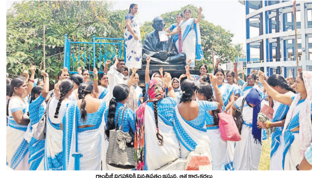
గాంధీజీ విగ్రహానికి వినతివ్రతం ఇస్తున్న ఆశ కార్యకర్తలు