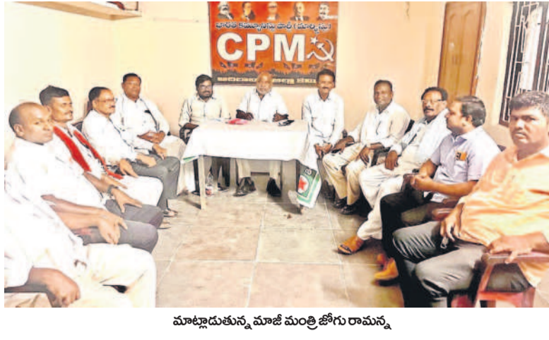
మాట్లాడుతున్న మాజీ మంత్రి జోగు రామన్న