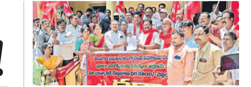
తానీల్లార్ల కార్యాలయంలో వివేకానందం ఆంధ్రప్రదేశ్ మాజీ ఎమ్మెల్యే జూలకంటి రంగారెడ్డి

ఉండవచ్చు. గన్నీ బ్యాగ్స్ లేవు.. కాంటాలు రావేదు.. నల్లగొండ జిల్లాలో ఈ సీజన్లో 11.26 లక్షల ఎకరాల్లో చరి సాగు చేయగా 12.14 లక్షల మెట్రిక్ టన్నుల ధాన్యం ఉత్పత్తి అవుతుందని అధికారులు అంచనా. అందులో మిల్లర్లు 5.68 లక్షల మెట్రిక్ టన్నులు కొంటే ప్రభుత్వ రంగ సంస్థల మార్కెట్లకు 5.57 లక్షల మెట్రిక్ టన్నుల ధాన్యం వస్తే అవకాశాలు ఉన్నాయి. జిల్లాలో ఇప్పటికే 10 నుంచి 20 శాతం పరికోతలు పూర్తి కాగా ఆ ధాన్యం సరఫరా కోలు కేంద్రాలకు వచ్చింది. ధాన్యం కొనుగోలు చేయడానికి సోమవారం