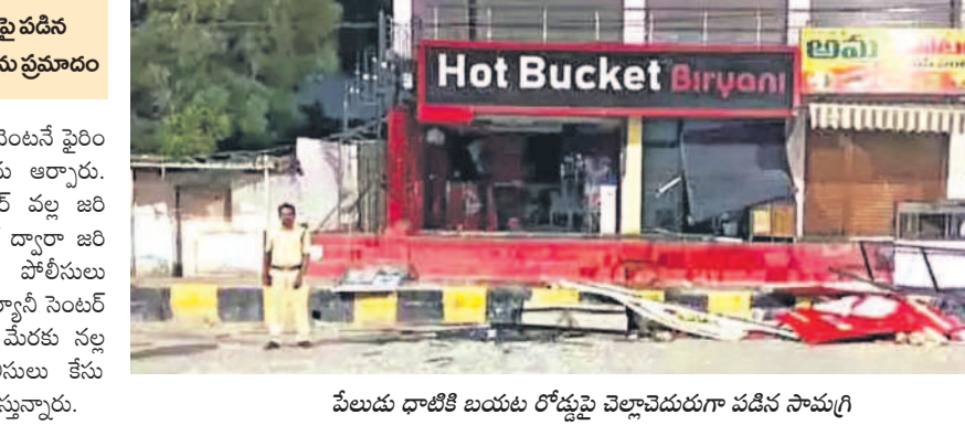
వేలుడు ధాటికి బయట రోడ్డుపై చెల్లాచెదురుగా పడిన సామగ్రి