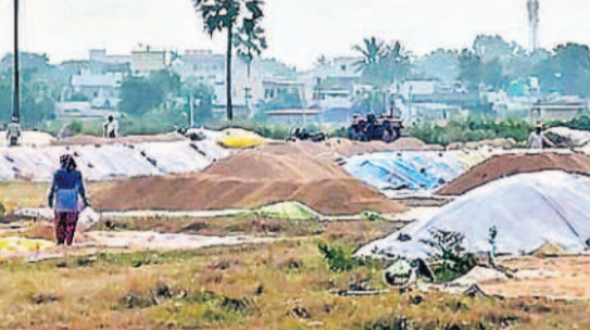
అర్ధరాత్రి కొనుగోలు కేంద్రంలో అరబోసిన ధాన్యం

నల్లగొండ, మార్చి 25 : గతేడాది యూనెస్కోలో ఏప్రిల్ మొదటి వారం వరకు ధాన్యం కొనుగోలు కేంద్రాలు ప్రారంభించడం విమర్శలు ఎదుర్కొన్న ప్రభుత్వం ఈ సారి ఆ సమస్య రాకుండా ముందస్తుగానే జాగ్రత్త పడుతున్నది. కానీ కేంద్రాలు తొందరగా ప్రారంభమైనా ధాన్యం కొనుగోలు మాత్రం అలస్యం చేయనున్నట్లు తెలుస్తున్నది. నల్లగొండ మండలంలోని అర్ధరాత్రి బావిలోపాటు తిప్పర్తి మండల కేంద్రంలో ధాన్యం కొనుగోలు కేంద్రాలను సోమవారం మంత్రి కోమటిరెడ్డి వెంకటరెడ్డి ప్రారంభించారు. ఇప్పటికే ఆయా కేంద్రాలకు ధాన్యం వచ్చినప్పటికీ ధాన్యం మాత్రం కొనవద్దని నిర్మాణాలకు లకు సివిల్ సప్లయ్ యంత్రాంగం ఆదేశాలు ఇచ్చింది. ఏప్రిల్ మొదటి వారం తర్వాత ధాన్యం కొనాలని సూచించడంతో అప్పటి వరకు కేంద్రాలు పేరుకే