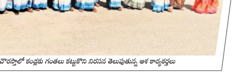
గంటిరావుపేట: రోడ్డుపై బ్రైలాయించి నిరదీక్షలు ఆశ కార్యకర్తలు