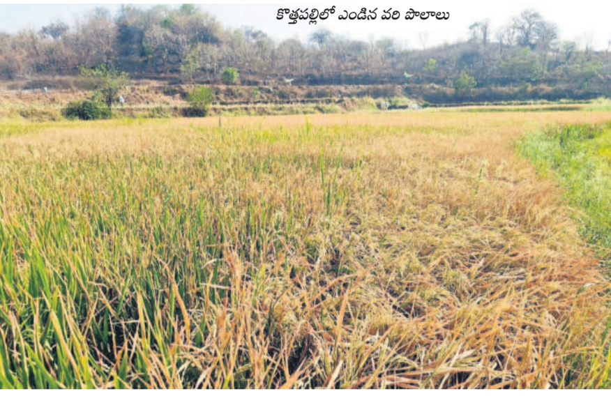
కొత్తపల్లిలో ఎండిన పంట పొలాలు