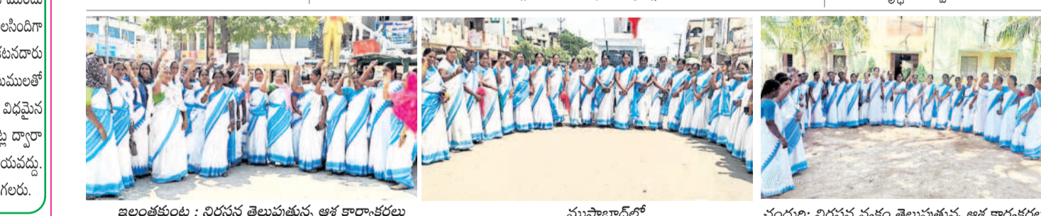
ఇల్లంతకుండు : నిరసన తెలుపుతున్న ఆశ కార్యకర్తలు