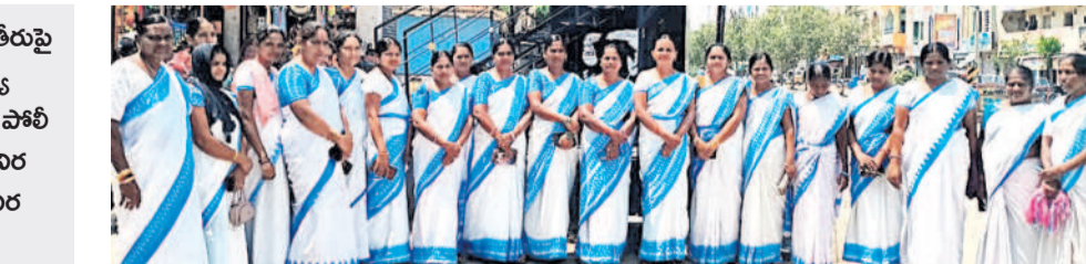
ఎల్లారెడ్డిపేట : గొల్లపల్లిలో నిరసన తెలుపుతున్న ఆశ కార్యకర్తలు

ఆశ కార్యకర్తలు కదం తొక్కారు. ప్రభుత్వం తీరుపై మండిపడ్డారు. హైదరాబాద్ లోని ఆరోగ్య శాఖ కమిషనరేట్ ముట్టడికి వెళ్లకుండా పోలి సులు ముందస్తు అరెస్టులు చేయడాన్ని నిరసిస్తూ మంగళవారం జిల్లా వ్యాప్తంగా నిరసన, ధర్నా చేశారు.