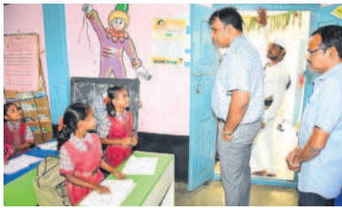
విద్యాల్లో మాట్లాడుతున్న కలెక్టర్

కలెక్టర్, మార్చి 25 : జిల్లాలోని రైతులు పండించిన ధాన్యం మద్దతు కరణి కొనుగోలు చేసేందుకు కట్టబడివున్న ఏర్పాట్లు చేయాలని కలెక్టర్ సందేశం మార్చి రూ. ఆదిశంకారం. మంగళవారం కలెక్టర్ డి.ఎం. అదనపు కలెక్టర్ ధీమాన్యాయకత్వంలోని ధాన్యం కొనుగోళ్ల అధికారులతో రివ్యూ