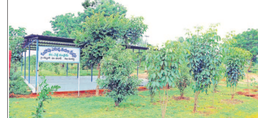
నాడు.. కేసీఆర్ ప్రభుత్వంలో కక్కలూరులోని కంపోస్ట్ షెడ్ పరిసరాల్లో ఏర్పాటు చేసిన పచ్చని మొక్కలు.. నేడు నీళ్లు లేక ఎండిపోయి కళకళలాడడం ఇలా..