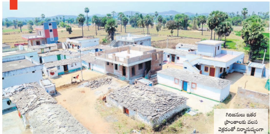
గిరిజనులు ఇతర ప్రాంతాలకు వలస వెళ్లడంతో నిర్మాణవ్యయంగా మారిన బిందెంగడ్డతండా

సన్నగిల్లిన వలస వెళ్తున్నారు. గత సీఎం కేసీఆర్ పాలనాకాలం-రంగారెడ్డి ఎత్తిపోతల పథకాన్ని పూర్తి చేసి సాగునీరు తీసుకొచ్చి వలసలను శాశ్వతంగా దూరం చేయడమే లక్ష్యంగా పక్కా ప్రణాళికతో ముందుకెళ్లే.. రేపంతో సర్కార్ మాత్రం అన్ని వర్షాల అన్యాయం చేస్తున్నది. ఫార్మా కంపెనీలతోపాటు పలు పరిశ్రమల ఏర్పాటు కోసం ఎకరం, రెండెకరాల భూములు ఉన్న అన్నదాతల నుంచి బలవంతంగా పొలాలను లాక్కుంటుండడంతో రైతులు, ప్రజలు వలసబాటు పడుతున్నారు. పరిగి, కొడంగల్ నియోజకవర్గాల్లోని తండాలకు చెందిన వందలాది కుటుంబాలు తమ ఉద్దేశం వదిలి ఉపాధి కోసం ముంబై, పుణే, హైదరాబాద్ కు వలస వెళ్లారు. పరిగి సెగ్మెంట్ కులకచర్ల మండలంలోని పలు తండాల్లో చాలా ఇండ్లు జనాల్లేక నిర్మాణవ్యయంగా దర్శనమిస్తున్నాయి. బిందెంగడ్డతండా, చింతలేకుంట తండా తదితర తండాల్లో ఏ ఇంటిని చూసినా తాళలే కనిపిస్తున్నాయి. కొందరు ఇండ్లకు తాళాలు వేసి పిల్లజెల్లలతో కలిసి పూలు పంపిస్తుంటూ తమ కుటుంబ సభ్యులు ఎప్పుడోసార్లో అని వెయ్యి పక్కతో ఎదురుచూస్తున్న దయనియ పరిస్థితులు నెలకొన్నాయి. కులకచర్ల, డోమ, బొంబాయిపేట, దుద్దాల మండలాల్లోని పలు తండాల్లో వందలాది కుటుంబాలు వలస వెళ్లాయి.