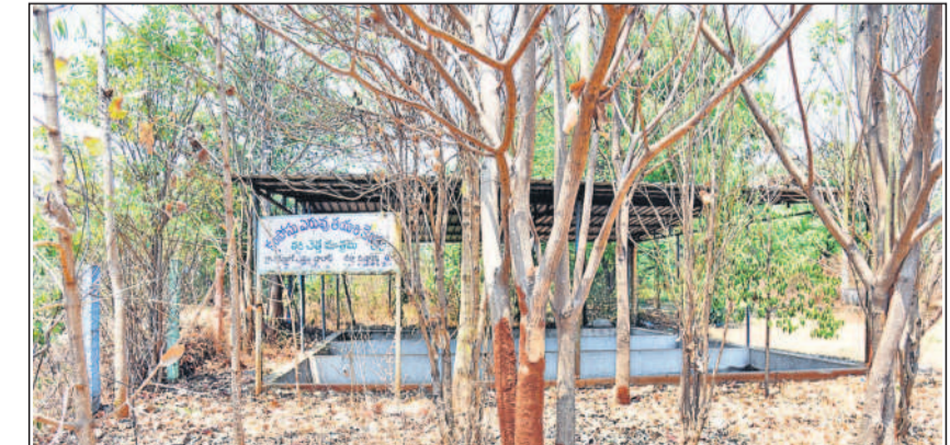
నేడు నీళ్లు లేక ఎండిపోయి కళకళలాడడం ఇలా..