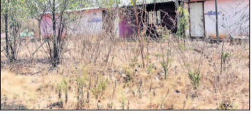
నాడు..కక్కలూరులో వైకుంఠదామం వద్ద కేసీఆర్ హయాంలో ఏర్పాటు చేసిన స్నానాల గదులు.. నేడు పిల్చిమొక్కలతో ఇలా..

నీళ్లు లేక ఎండిపోతున్న మొక్కలు కేసీఆర్ హయాంలో పచ్చని మొక్కలతో కళకళలాడిన పల్లెప్రకృతి వనంలోని మొక్కలు.. ప్రస్తుతం సరిపడా నీరందక ఎండిపోతున్నాయి. కంపోస్ట్ యార్డు కూడా ఎండిపోయిన మొక్కల మధ్య వెల వెలపోతున్నది. వైకుంఠదామంలో స్నానాలు చేసే గదుల ఆవరణలో పిల్చిమొక్కలు మొలవడంతో అక్కడ అడవిని తలపిస్తున్నది. ముంబై-బెంగళూరు లింకు జాతీయ రహదారి పక్కనే ఉన్న రైతువేదిక పచ్చని మొక్కల మధ్య కళకళలాడుతూ చూపరులను ఆకట్టుకునేది. ఇప్పుడు ఆ మొక్కలకు నీళ్లు లేక ఎండిపోతున్నాయి. గ్రామంలోని మురుగుకాలువలు ఏరుల్ని పారేస్తున్నాయి. గత 14 నెలలుగా గ్రామాల్లో ప్రజాప్రతినిధులు లేకపోవడం, ప్రస్తుత ప్రభుత్వం గ్రామాలను పట్టించుకోవడం లేక ఇబ్బందులకు గురవుతున్నామని ప్రజలు ఆవేదన వ్యక్తం చేస్తున్నారు.