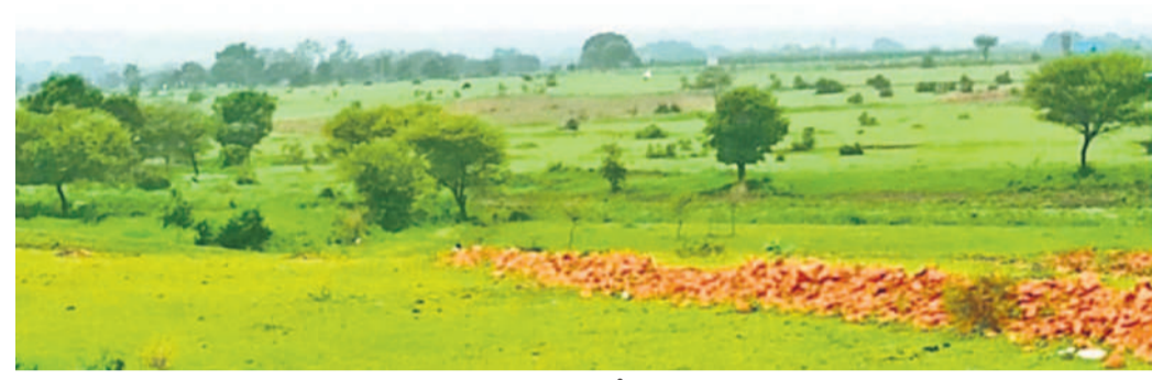
సంగారెడ్డి జిల్లా నాగల్గొద్ల మండలం ఏసీ శివారులో చెరువు నిర్మాణ స్థలం

చెరువు.. పట్టణ ఆదెరువు అంటారు. ఒక్క చెరువు ఎంతో మందికి ఉపాధిని ఇస్తుంది. చేపల పెంపకంతో మత్స్యకారులు, మురియాళ్లు ఉపాధి పొందుతుంటారు. చెరువు నీటితో రైతులు పంటలు పండించుకుంటారు. చెరువు కట్టపై ఈత చెట్ల సహకారంతో గొడ్డన్నలు కట్టగిరిని అమ్మ జీవనోపాధి పొందుతుంటారు. ఇతరులు బట్టలను ఉత్పత్తి చేసి ఆదాయం పొందుతారు. పశుపక్ష్యాదుల గొంతుతయ్యే తుంది చెరువు. నీరు లేనిదే నమస్తే జీవనాశులు మనుగడ చాలించలేవు. ఒక్క చెరువు నిర్మాణంతో ఆ ఊరి స్థితికి మారుతాయి. తెలంగాణ ప్రజల జీవన విధానంలో చెరువులకు ప్రముఖ స్థానం ఉన్నది. జీఎల్ఎస్ హయాంలో 'మిషన్ కాకతీయ' పథకంలో అనేక చెరువులను అభివృద్ధి చేసి పూర్తి వైభవం తెచ్చింది. ఇదేకొవలో సాగు నీటి వసతి అంతంతమాత్రంగా ఉన్న సంగారెడ్డి జిల్లా నారాయణపేట ప్రాంత ప్రజలకు ఆదెరువు కల్పించేందుకు అప్పటి నీటి కేసీఆర్ కొత్త చెరువుల మంజూరు చేశారు. కాంగ్రెస్ ప్రభుత్వం వచ్చాక కొత్త చెరువుల నిర్మాణ పనులు ముందుకు సాగకపోవడంతో రైతులు నిరాశ చెందుతున్నారు.