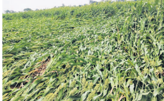
సంగారెడ్డి జిల్లా నదావిపేటలో నేలకొరిగిన జొన్న పంట

సంగారెడ్డి, మార్చి 25 (నమస్తే తెలంగాణ): సంగారెడ్డి జిల్లాలో ఇటీవల కురిసిన వడగండ్ల వానకు 184 ఎకరాలలో పంటనష్టం వాటిల్లి నష్ట వ్యవసాయశాఖ ప్రభుత్వానికి ప్రాథమిక నివేదికను అందజేసింది. అంతకంటే ఎక్కువగానే పంటనష్టం జరిగిందని రైతులు చెబుతున్నారు. అకాల వర్షాలు, ఇతర విపత్తుల కారణంగా 83 శాతానికి పైగా నష్టం జరిగితేనే వ్యవసాయశాఖ పంటనష్టంగా పరిగణనలోకి తీసుకుని ప్రభుత్వం నివేదిక అందజేస్తుంది. సంగారెడ్డి జిల్లాలో 500 ఎకరాలకు పైగా పంటనష్టం జరిగిందని, అందరికీ పరిహారం అందించాలని రైతులు, రైతుసంఘాలు డిమాండ్ చేస్తున్నాయి. నదావిపేట మండలంలోని తంగోడుపల్లి, నాగుపల్లి, మునిపల్లి