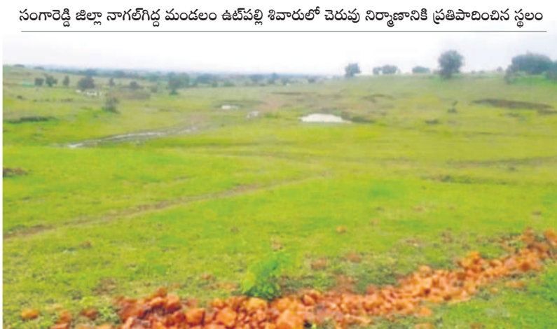
సంగారెడ్డి జిల్లా నాగల్గొద్ల మండలం ఉజ్జ్వల శివారులో చెరువు నిర్మాణానికి ప్రతిపాదించిన స్థలం