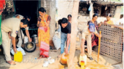
బిల్లు పానకాన్ని పారబోస్తున్న ఎక్సైజ్ పోలీసులు