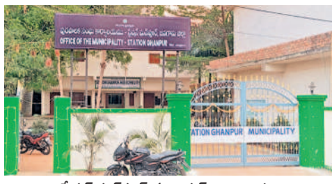
స్టేషన్ ఘనీపూర్ మున్సిపల్ కార్యాలయం