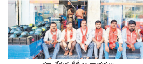
ధర్నా చేస్తున్న సీపీఎం నాయకులు