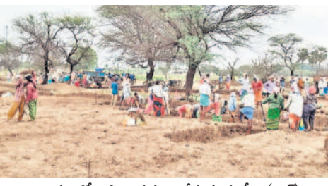
చాగల్లలో ఉపాధి పనులు చేస్తున్న కూలీలు(ఫైల్)

స్టేషన్ ఘనీపూర్, మార్చి 26: మున్సిపాలిటీగా మారితే గ్రామాల మరంత అభివృద్ధి చెందాలంటే కొంత మంది హామీ పథకం వర్తింపజేయడంతో కూలీలు ఉపాధి కోల్పోయారు. స్టేషన్ ఘనీపూర్ మున్సిపాలిటీగా మారడం ఆవేదన వ్యక్తం చేస్తున్నారు.