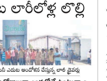
ఇథనాల్ కంపెనీ ఎదుట ఆందోళన చేస్తున్న లారీ డ్రైవర్లు

అన్లోడ్ చేయడం లేదని డ్రైవర్ల ఆక్రోశం యాజమాన్యం నిర్లక్ష్యంతో బారులు డిబ్బన లారీలు మరకల్, మార్చి 26 : మండలంలోని చిక్కనూర్ సమీపంలోని జూరాల ఆగ్రో ఇథనాల్ కంపెనీ వద్ద బుధవారం లారీ డ్రైవర్లు అందో భయం వేస్తున్నారని తెలుస్తోంది. వారం రోజుల నుంచి లారీలో ఉన్న దానాన్ని కంపెనీ యజమాన్యం అన్లోడ్ చేసుకోవడం లేదని వారు ఆవేదన వ్యక్తం చేశారు. ఇథనాల్ తయారీకి తెలంగాణ, ఆంధ్ర రాష్ట్రం నుంచి సుమారు 200 లారీలోళ్ల కొన్ను, బియ్యం, సూరకలు, మొక్కజొన్న దానాను వచ్చి వారం రోజులు అవుతున్నా కంపెనీ యజమాన్యం సుబ నిర్లక్ష్యం వల్ల ఎక్కడిక్కడ లారీలు ఆగిపోయాయి. లారీలోని దానాన్ని అన్లోడ్ చేసుకోవాలని బతిమాలు తప్పా అక్కడి సిబ్బంది నిర్లక్ష్యం వల్ల డ్రైవర్లు అందరూ పన్నులులేక పరిస్థితి ఏర్పడింది. కనీసం లారీలోని దానాను కంపెనీ తిండి లేక తీవ్ర ఇబ్బంది పడుతున్నారని కనీసం వెల్లడకు బయట. యజమాన్యం వెంటనే అన్లోడ్ చేసుకోవాలని లారీ డ్రైవర్లు కోరు తున్నారు.