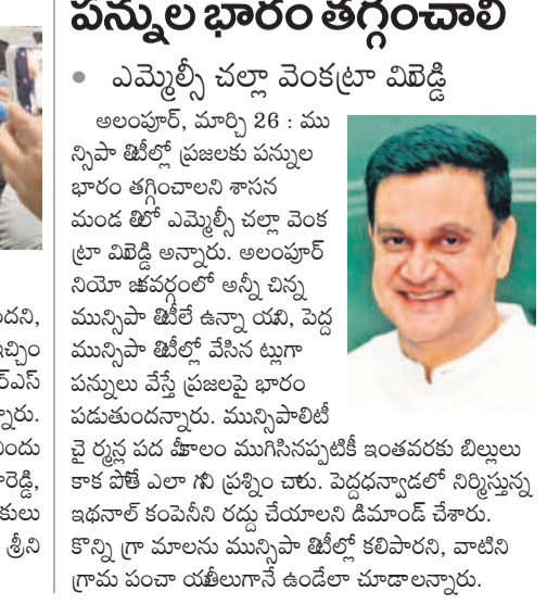
అలంపూర్, మార్చి 26 : మున్సిపాలిటీ ప్రజలకు పన్నుల భారం తగ్గించాలని శాసన మండలి ఎమ్మెల్యే చల్లా వెంకట్రా విమర్శించారు.

అలంపూర్, మార్చి 26 : మున్సిపాలిటీ ప్రజలకు పన్నుల భారం తగ్గించాలని శాసన మండలి ఎమ్మెల్యే చల్లా వెంకట్రా విమర్శించారు. అలంపూర్ నియోజకవర్గంలో అన్ని చిన్న మున్సిపాలిటీలలో అన్ని యే, పెద్ద మున్సిపాలిటీలలో వేసిన ట్యూ పన్నులు వేస్తే ప్రజలపై భారం పడుతుందన్నారు. మున్సిపాలిటీల పన్నులను తగ్గించాలని శాసన మండలి ఎమ్మెల్యే చల్లా వెంకట్రా విమర్శించారు. అలంపూర్ నియోజకవర్గంలో అన్ని చిన్న మున్సిపాలిటీలలో అన్ని యే, పెద్ద మున్సిపాలిటీలలో వేసిన ట్యూ పన్నులు వేస్తే ప్రజలపై భారం పడుతుందన్నారు. మున్సిపాలిటీల పన్నులను తగ్గించాలని శాసన మండలి ఎమ్మెల్యే చల్లా వెంకట్రా విమర్శించారు. అలంపూర్ నియోజకవర్గంలో అన్ని చిన్న మున్సిపాలిటీలలో అన్ని యే, పెద్ద మున్సిపాలిటీలలో వేసిన ట్యూ పన్నులు వేస్తే ప్రజలపై భారం పడుతుందన్నారు. మున్సిపాలిటీల పన్నులను తగ్గించాలని శాసన మండలి ఎమ్మెల్యే చల్లా వెంకట్రా విమర్శించారు.