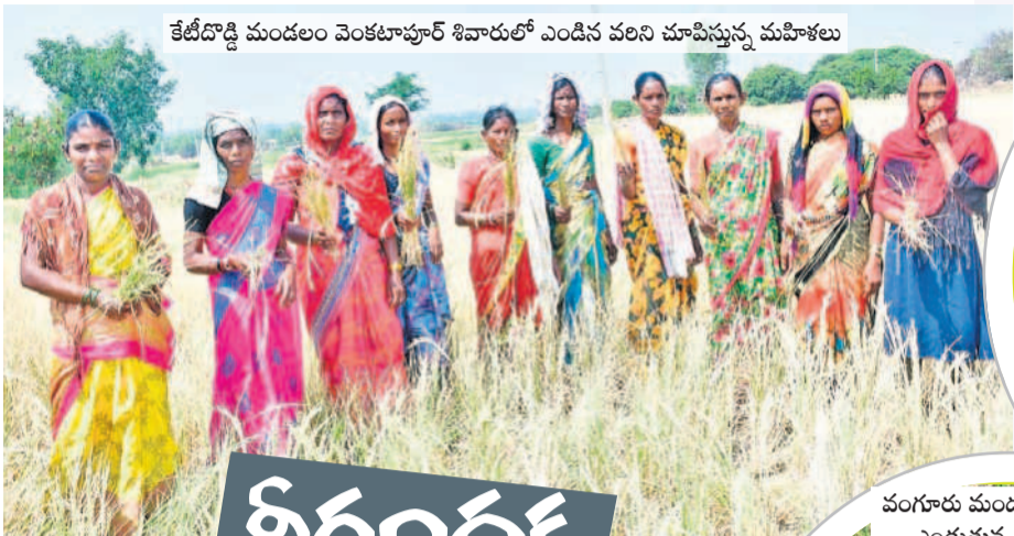
కేటీడోడ్డి మండలం వెంకటాచార్య శివారులో ఎండిన పంటల మామిడిపప్పును మహిళలు