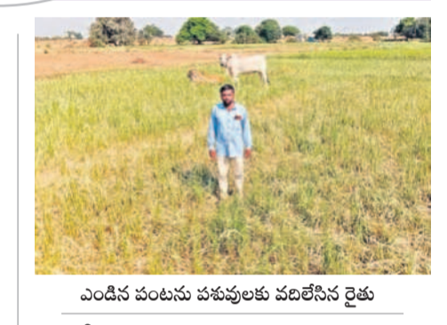
ఎండిన పంటలను పశువులకు వదిలేసిన రైతు