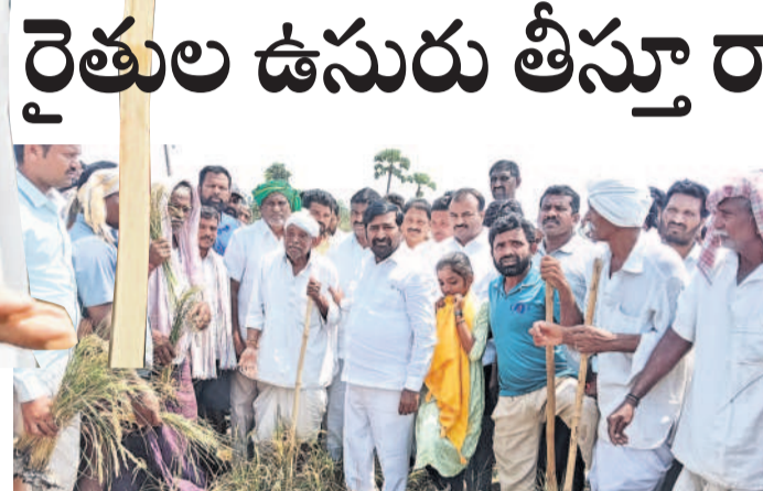
వివ్వల మండలం మొగ్గయ్యగూడెంలో ఎండిన పంటలను పరిశీలించి రైతు భూమి తేజాను ఓదారుస్తున్న మాజీ మంత్రి, ఎమ్మెల్యే జగదీశ్ రెడ్డి