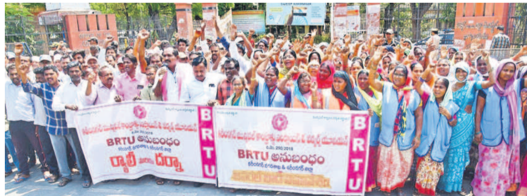
కరీంనగర్ కలెక్టరేట్ ఎదుట ఆందోళన చేస్తున్న కార్యకులు