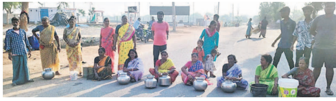
మంచి నీటి కోసం ఖాళీ బిందెలతో రోడ్లపై బెయిలుని నిరసన తెలుపుతున్న మహిళలు

ముస్తాబాద్, మార్చి 26: మంచి నీటి కోసం మహిళలు రోడ్లెక్కిన వారం నుంచి మంచి నీరు లేక ఇబ్బందిపడుతున్నామని.. వెంటనే నీటిని సరఫరా చేయాలని డిమాండ్ చేశారు. ఈ మేరకు బుధవారం ముస్తాబాద్ మండల కేంద్రంలోని ధళివాడలో ఖాళీ బిందెలతో నిర్దేపిట - ముస్తాబాద్ ప్రధాన రహదారిపై నిరసన తెలిపారు. వారం నుంచి నీళ్లేండుకు సరఫరా చేస్తే లేదని ప్రశ్నించారు. ఇప్పటికైనా అధికారులు స్పందించి ప్రకం తప్పకుండా నీటిని విడుదల చేయాలని డిమాండ్ చేశారు.