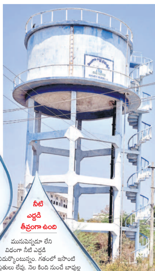
నీటి ఎద్దడి తీవ్రంగా ఉంది

మునుపెన్నడూ లేని విధంగా నీటి ఎద్దడి ఎదుర్కొంటున్నాం. గతంలో ఇసాంటి పరిస్థితులు లేవు. నెల కింది నుంచే బావుల్ల నీళ్లు ఒడుస్తున్నాయి. మంచి నీళ్లు బాయిల సుతం నీళ్లు తగ్గవున్నాయి. ఉన్న నీళ్లనే ఊరంతా తింపి వరకు ఎటు సరిపోతే లేవు. ఎండలు ఇంకా ముదిరితే నీళ్లు చాలా కష్టమైతే, ఇప్పటి సందే నీళ్ల కోసం ప్రత్యామ్నాయం చూడాలి. లేకుంటే గ్రామాలకు గ్రామాలు తల్లడిల్లుతాయి. మా ఊరికి మునుపు మంచి నీళ్లు మంచినీ వచ్చేవి. ఇప్పుడు నాలుగైదు రోజులకు ఒక వాడకు తిరుగుతున్నాయి. రేపు వారం పది రోజులకోసారి సుతం నీళ్లు వచ్చి పరిస్థితి కనిపిస్తుంది.