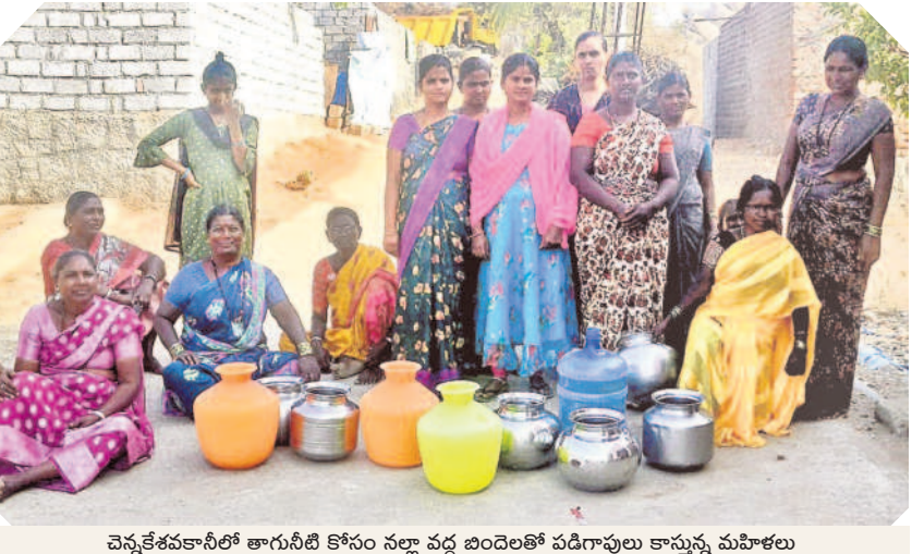
చెన్నకేశవనాసిలో తాగునీటి కోసం నల్ల వద్ద బందెలతో పడిగావులు కాస్తున్న మహిళలు