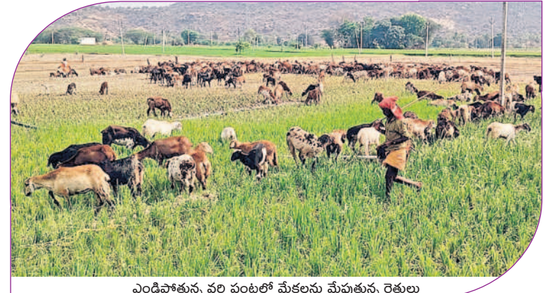
ఎండిపోతున్న పంటలలో మేకలను మేపుతున్న రైతులు

I హైదరాబాద్, గురువారం 27 మార్చి 2025 RANGAREDDY