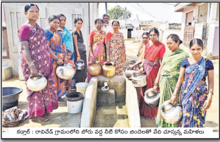
కడ్రాల్ : రావిచేడి గ్రామంలోని బోరు వద్ద నీటి కోసం బందెలతో వేచి చూస్తున్న మహిళలు