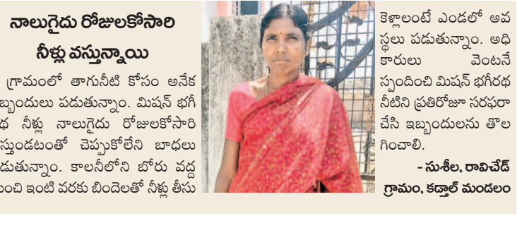
కెల్లాలంటే ఎండలో అవస్థలు పడుతున్నాయి. అధికారులు వెంటనే స్పందించి మిషన్ భగీరథ నీటిని ప్రతిరోజూ సరఫరా చేసి ఇబ్బందులను తొలగించాలి.

కడ్రాల్ : మండలంలోని రావిచేడి గ్రామంలో మిషన్ భగీరథ నీళ్లు నాలుగైదు రోజులకోసారి సరఫరా చేస్తుండడంతో ప్రజలు అనేక అవస్థలు పడుతున్నారు. దీంతో గ్రామంలో ఇదివరకు ఏర్పాటు చేసిన బోరు వద్ద నీటి కోసం మహిళలు ఇబ్బందులు పడుతున్నారు. దీనికోసం భూగర్భ జలాలు అడుగుంటడంతో గ్రామాల్లో బోరు సరిగ్గా పోయడంలేదు. నీళ్లు కరువు ఇంతలా ఎప్పుడూ చూడలేదని మహిళలు వాపోతున్నారు. మహిళలు పడుతున్న బాధను ఆర్డం చేసుకొని మిషన్ భగీరథ పథకాన్ని ప్రవేశపెట్టి.. ఇంటింటికీ నీళ్లు అందించిన పునక కేసీఆర్ కి ధన్యవాదాలు తెలిపారు. మార్చి నెలలోనే పరిష్కారం ఇలా ఉంటే ఏప్రిల్, మే నెలల్లో నీటి సమస్య ఎలా ఉంటుందనే భయం ప్రజల్లో నెలకొన్నది.