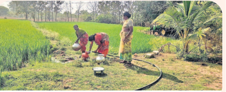
చాపలగూడెంలో వ్యవసాయ బోరు వద్ద నీటిని పట్టుకుంటున్న మహిళలు