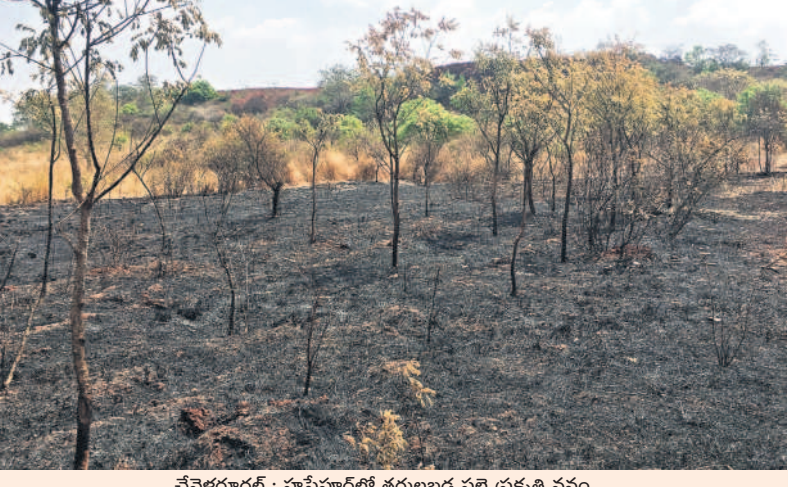
వేవేగూడెం : హస్తినూరులో కరువుల వల్ల ప్రకృతి వనం

వేవేగూడెం, మార్చి 25 : తెలంగాణ తొలి ముఖ్యమంత్రి కేసీఆర్ గత 10 సంవత్సరాల పాలనలో గ్రామాల్లో పచ్చదనం ఫలించలేదు. కానీ ఇప్పుడు అందుకు భిన్నంగా గ్రామాల్లో పచ్చదనం కనిపిస్తోంది. పల్లె ప్రకృతిలో భాగంగా గ్రామాల్లో పారిశుధ్యంలో నాణ్యత మొక్కలకు నీరు అందకనే ఇది ఎండిపోయి కనిపిస్తున్నాయి. 70 శాతం దగ్గరైన పల్లె ప్రకృతి వనం వేవేగూడెం మండల పరిధి హస్తినూరు గ్రామంలోని పల్లె ప్రకృతి వనంలో గుర్తు తెలియని వృక్షాలు నిర్మూలించడంతో 70 శాతం మొక్కలు కాగి బూడిదయ్యాయి. అధికారుల చర్యలేక కరువుచెంది, పట్టించుకోని నాడు లేదని ప్రజలు వాపోతున్నారు. పచ్చదనంపై పట్టింపి..? మొయినాబాద్ : గత ప్రభుత్వంలో కేసీఆర్ ఉన్న ఆశయంతో పల్లె ప్రకృతి వనాలను ఏర్పాటు చేయడంతో పాటు ఎక్కడ ప్రభుత్వ భూములు కనిపించినా మొక్కలు నాటి పచ్చదనాన్ని పెంచారు. గ్రామగ్రామానా అక్కడ మొక్కలను నాటి వాటిని పంచాయతీ సిబ్బంది కంటే కంటే రెండు రోజుల పాటు సంరక్షించారు. చెట్లకు నీళ్లు పెట్టి ఏర్పాటు పెంచారు. కానీ ప్రజాపాలన అని గొప్పలు చెప్పుకొంటున్న కాంగ్రెస్ ప్రభుత్వం పచ్చదనాన్ని పట్టించుకోవడంలేదు. మొయినాబాద్ మున్సిపాలిటీలో ఉన్న గ్రామాలలో పాటు మొయినాబాద్ మండలంలో ఉన్న గ్రామాల్లో పల్లె ప్రకృతి వనాలకు నీళ్లు అందించకపోవడంతో ఎందుతున్నాయి. మున్సిపాలిటీ అధికారులు కానీ, పంచాయతీ శాఖ అధికారులు