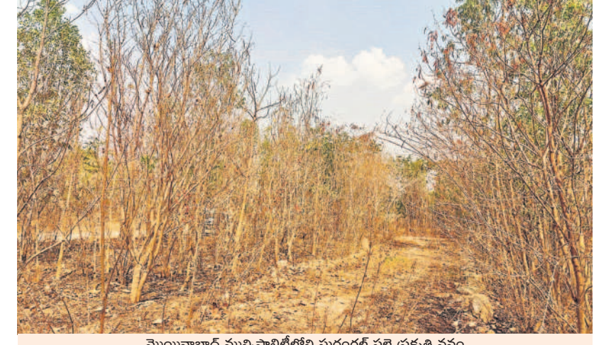
మొయినాబాద్ మున్సిపాలిటీలోని సురంగల్ పల్లె ప్రకృతి వనం

వేవేగూడెం, మార్చి 25 : తెలంగాణ తొలి ముఖ్యమంత్రి కేసీఆర్ గత 10 సంవత్సరాల పాలనలో గ్రామాల్లో పచ్చదనం ఫలించలేదు. కానీ ఇప్పుడు అందుకు భిన్నంగా గ్రామాల్లో పచ్చదనం కనిపిస్తోంది. పల్లె ప్రకృతిలో భాగంగా గ్రామాల్లో పారిశుధ్యంలో నాణ్యత మొక్కలకు నీరు అందకనే ఇది ఎండిపోయి కనిపిస్తున్నాయి. 70 శాతం దగ్గరైన పల్లె ప్రకృతి వనం వేవేగూడెం మండల పరిధి హస్తినూరు గ్రామంలోని పల్లె ప్రకృతి వనంలో గుర్తు తెలియని వృక్షాలు నిర్మూలించడంతో 70 శాతం మొక్కలు కాగి బూడిదయ్యాయి. అధికారుల చర్యలేక కరువుచెంది, పట్టించుకోని నాడు లేదని ప్రజలు వాపోతున్నారు. పచ్చదనంపై పట్టింపి..? మొయినాబాద్ : గత ప్రభుత్వంలో కేసీఆర్ ఉన్న ఆశయంతో పల్లె ప్రకృతి వనాలను ఏర్పాటు చేయడంతో పాటు ఎక్కడ ప్రభుత్వ భూములు కనిపించినా మొక్కలు నాటి పచ్చదనాన్ని పెంచారు. గ్రామగ్రామానా అక్కడ మొక్కలను నాటి వాటిని పంచాయతీ సిబ్బంది కంటే కంటే రెండు రోజుల పాటు సంరక్షించారు. చెట్లకు నీళ్లు పెట్టి ఏర్పాటు పెంచారు. కానీ ప్రజాపాలన అని గొప్పలు చెప్పుకొంటున్న కాంగ్రెస్ ప్రభుత్వం పచ్చదనాన్ని పట్టించుకోవడంలేదు. మొయినాబాద్ మున్సిపాలిటీలో ఉన్న గ్రామాలలో పాటు మొయినాబాద్ మండలంలో ఉన్న గ్రామాల్లో పల్లె ప్రకృతి వనాలకు నీళ్లు అందించకపోవడంతో ఎందుతున్నాయి. మున్సిపాలిటీ అధికారులు కానీ, పంచాయతీ శాఖ అధికారులు