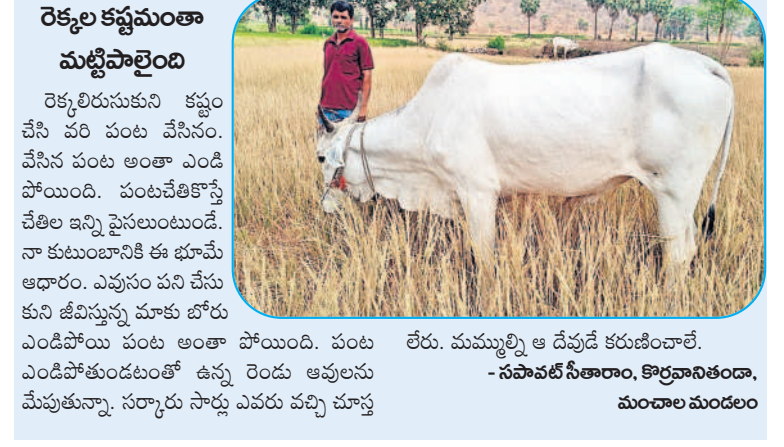
రేరు. ముమ్మల్ని ఆ దేవుడి కరుణించాలి.

రెక్కలు కష్టమంతా మట్టిపాలైంది రెక్కలు కష్టమంతా మట్టిపాలైంది. రెక్కలు కష్టమంతా మట్టిపాలైంది. రెక్కలు కష్టమంతా మట్టిపాలైంది.