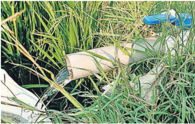
గంజిపల్లి తండాలో భారతా పోస్టును బోరు బావి

ఏర్పడుతున్న వ్యవసాయదారులు చెబుతున్నారు. ఎండకాలం కారణంగా