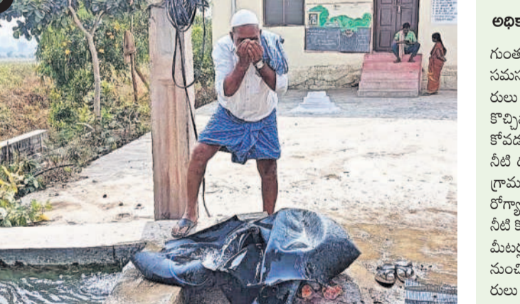
గుంతకాపాపల్లి వందాయతీ కార్యాలయం ముందున్న బోరులో నుంచి వచ్చిన కలుషిత నీరు

తాండూరు రూరల్, మార్చి 26: ఆ గ్రామంలోని వ్యవసాయ బోర్డర్లలో కలుషిత నీరు వస్తున్నది.