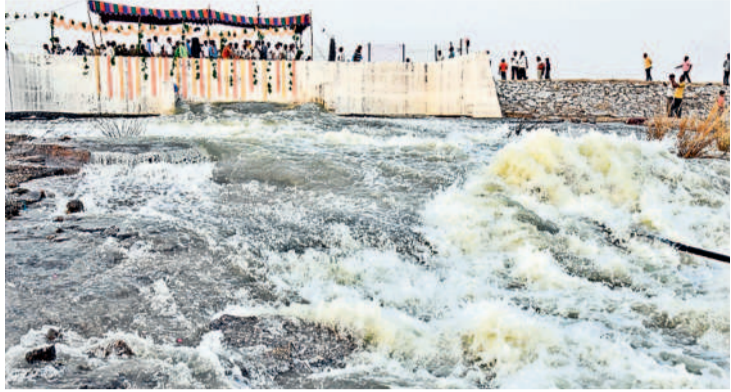
దేవన్నపేట పంపవహాని నుంచి ధర్మసాగర్ రిజర్వాయర్లోకి చేరుతున్న గోదావరి జలాలు