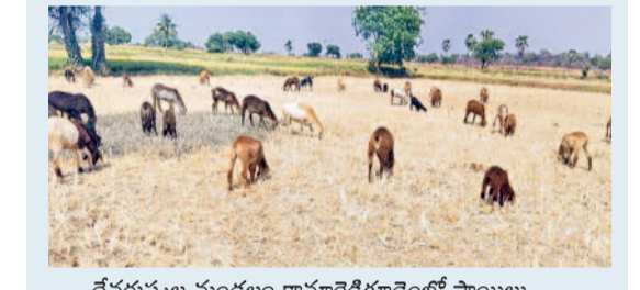
దేవరపల్లె మండలం కామారెడ్డిగూడెంలో సాయిలు కొనుగోలు చేసిన పరి పొలంలో మేస్తున్న గొర్రెలు

మా ఊళ్ల రైతుల పరి చేస్తు ఎండిపోతే ఎకరానికి రూ.5 వేలకు కొన్నా. పదికాలు కొని గొర్రు మేపుతున్నా. ఎండాకాలం మేతలేక ఆగం కాకుండా ఇవి ఆనరవుతున్నయ్యే. ఎండలు తంది కొడుతున్నయ్యే. పచ్చగడ్డి లేదు. తంపులు లేవు. ఎండిన పరి చేస్తే గొర్రు మేత యిలాంటిది. రైతుకు ఈ డబ్బులు కొంటేనా ఆసరేవు. కరువు కాలం కొడుతుంది. జీవాలకు నీళ్ల దొరుకుకుండా కష్టమే ఉంది. ప్రభుత్వం నీళ్లందిలి చెర్లు, కంటలు నింపాలి. లేకపోతే పరి ఎండినట్లే పంటలు నీళ్లలేక నష్టయ్యే. - మరొక సాయిలు, గొర్రెల యజమాని, కామారెడ్డిగూడెం, దేవరపల్లె