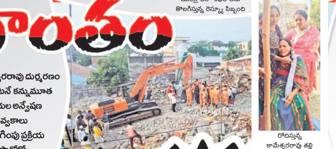
యంత్రాలతో శిథిలాలను తొలగిస్తున్న రెస్క్యూ సిబ్బంది