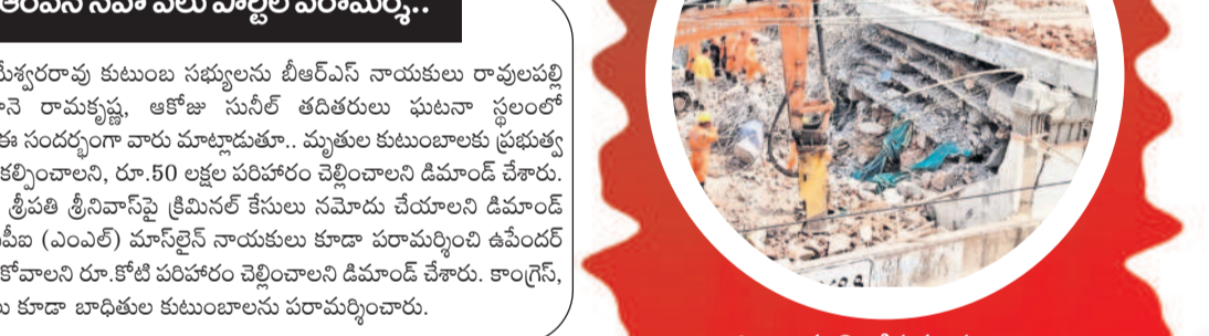
శిథిలాలను తొలగిస్తున్న యంత్రాలు