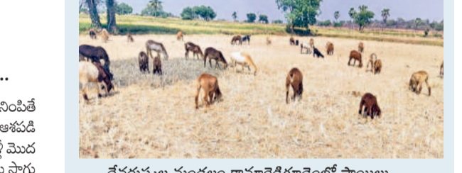
దేవరపల్లె మండలం కామారెడ్డిగూడెంలో సాయిలు కొనుగోలు చేసిన పంట పొలంలో మేపుతున్న గొర్రెలు

మా ఊళ్ల రైతుల పరి చేస్తు ఎండిపోతే ఏక రానికి రూ.5 వేలకు కొన్నా. పదికాలా కొని గొర్రె మేపుతున్నా. ఎండాకాలం మేతలేక ఆగం కాకుండా ఇవి ఆనరవుతున్నాయి. ఎండలు తుంది కొడుతున్నాయి. పచ్చగడ్డి లేదు. కమ్మలు లేవు. ఎండిన పరి చేస్తే గొర్రెకు మేత యిలాంటిది. రైతుకు ఈ డబ్బులు కొంటేనా ఆస రైతు. కరువు కాలం కొడుతుంది. జీవాలకు నీళ్లు దొరుకుకుండా కష్టమే ఉంది. ప్రభుత్వం నీళ్లివ్వాలి చెప్పి, కంటలు నింపాలి. లేకపోతే పరి ఎండినట్లే పంటలు నీళ్లకే వస్తున్నాయి. - మరొక సాయిలు, గొర్రెల యజమాని, కామారెడ్డిగూడెం, దేవరపల్లె