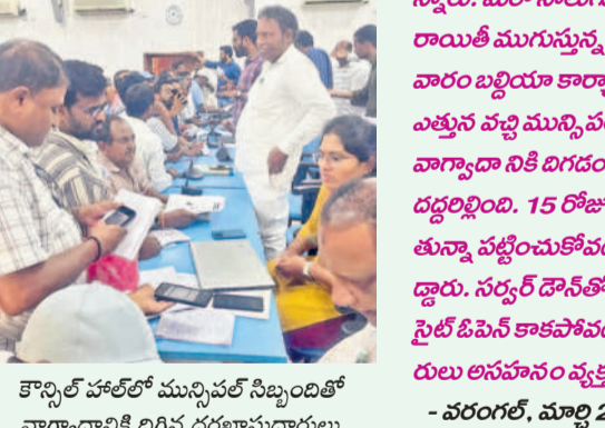
కౌన్సిల్ హోల్లో మున్సిపల్ సిబ్బందితో వాగ్వివాదానికి దిగిన దరఖాస్తుదారులు

కార్యాలయంలో పడిపోయి పడ్డారు. గురువారం సైతం సర్కర్ డౌన్ కావడంతో ఇబ్బందులు పడ్డారు. మార్చి 31తో ప్రభుత్వం ప్రకటించిన 25 శాతం రాయితి గడువు ముగిస్తున్న నేపథ్యంలో ఆర్టిదారులు అందివచ్చిన రాయితి అవకాశం చేజిక్కిరించుకునే అవకాశం ఉన్నారు. గడువు