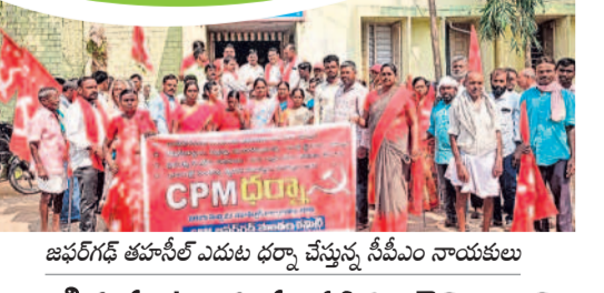
జనగామ జిల్లాలో ఎంపీలకు ధర్మా చేస్తున్న నీవేదీ నాయకులు

కార్యాలయంలో పడిపోయి పడ్డారు. గురువారం సైతం సర్కర్ డౌన్ కావడంతో ఇబ్బందులు పడ్డారు. మార్చి 31తో ప్రభుత్వం ప్రకటించిన 25 శాతం రాయితి గడువు ముగిస్తున్న నేపథ్యంలో ఆర్టిదారులు అందివచ్చిన రాయితి అవకాశం చేజిక్కిరించుకునే అవకాశం ఉన్నారు. గడువు