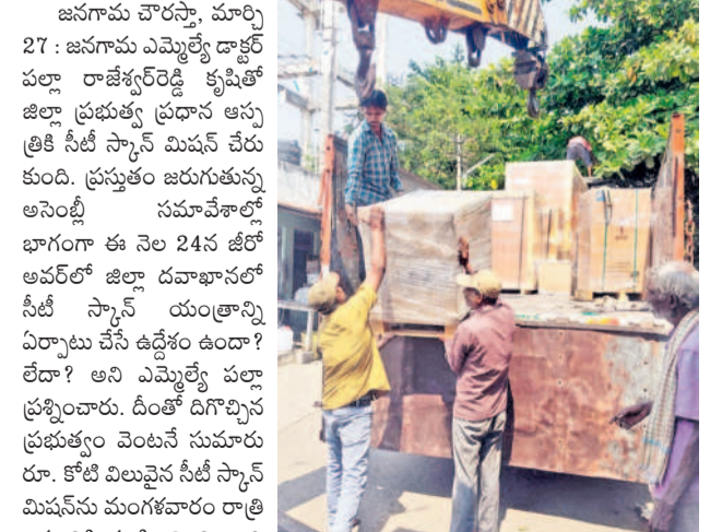
నీటి సాగ్స్ యంత్రాన్ని లాల్ నుంచి దించుతున్న కాలీలు