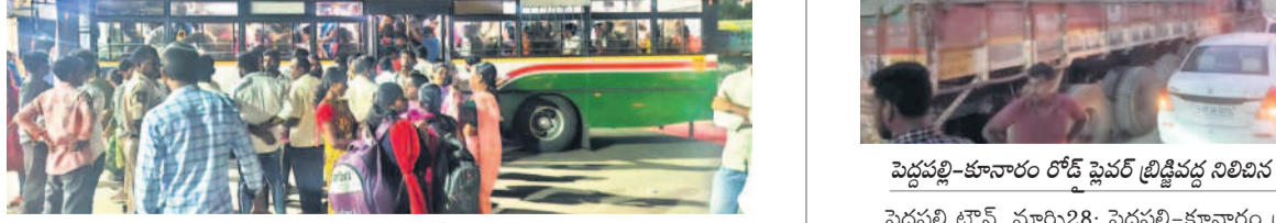
భూపాలపల్లికి వెళ్లే బస్సు కిక్కిరిసిపోవడంతో బయట ఉన్న ప్రయాణికులు

● మంధనిలో రెండుగంటలపాటు ప్రయాణికులు ఇక్కట్లు