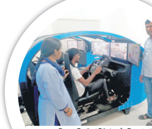
లైట్ మోటార్ వెహికల్ సిమ్యులేటర్పై యువతకు నైపుణ్య శిక్షణ ఇస్తున్న శిక్షకులు

రోడ్డు భద్రత, ప్రమాదాల నివారణకు అత్యంత తీవ్రంగా సంస్థ సహకారంతో నిష్పాతులైన శిక్షకులతో యువతకు 30 రోజులపాటు డ్రైవింగ్ శిక్షణ ఇస్తున్నది. అంతేకాదు, సంస్థనే డ్రైవింగ్ ట్రైనింగ్ సర్టిఫికేట్ కూడా అందిస్తున్నది. ఇందులో ఇప్పటి వరకు వివిధ రాష్ట్రాలకు చెందిన 5 వేల మంది లైట్ మోటార్, హెవీమోటార్ మోటార్ డ్రైవింగ్లో నైపుణ్య శిక్షణ పొందారు.