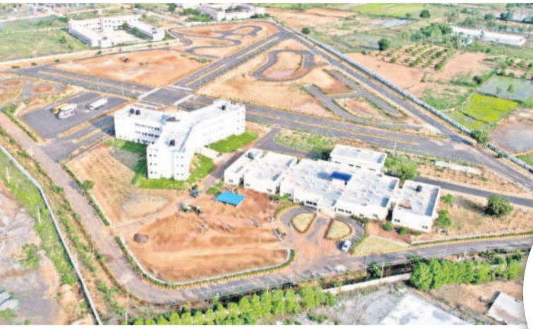
తంగుపల్లి మండలం మండెపల్లిలో నూతన మంత్రి కేటీఆర్ హయాంలో ప్రారంభించిన టీవీ డిజిటలైజేషన్ డ్రైవింగ్ స్కూలు

ప్రభుత్వ రంగ సంస్థ సినిమీల్లోని టీవీ డిజిటలైజేషన్ నిరుద్యోగులకు బాసటగా నిలుస్తున్నది. మోటార్ ఫీల్డ్స్ ఆఫ్ ఇండియా లోకల్ అథారిటీ అధికారుల ప్రయత్నాలతో నయా డ్రైవింగ్ ట్రైనింగ్ అందిస్తున్నది. రాష్ట్రంలోనే తొలి అంతర్జాతీయ డ్రైవింగ్ శిక్షణ సంస్థగా పేరొందిన సెంటర్, అప్పటి మంత్రి, ప్రస్తుత ఎమ్మెల్యే కేటీఆర్ చొరవతో తంగుపల్లి మండలం మండెపల్లిలో 20 ఎకరాల్లో ₹2.169 కోట్లతో నాలుగోళ్ల కిందట ఏర్పాటు. ఇప్పటి వరకు 5 వేల మందికిపైనే తరఫునిచ్చింది. అందులో పండితాని మందికి డ్రైవింగ్ డిప్లొమాలు సైతం అభివృద్ధి, ఈ కేంద్రానికి రోజురోజుకూ ఆదరణ పెరుగుతున్నది.