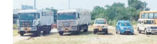
బడిలోలో శిక్షణ కోసం కేటాయించిన వాహనాలు