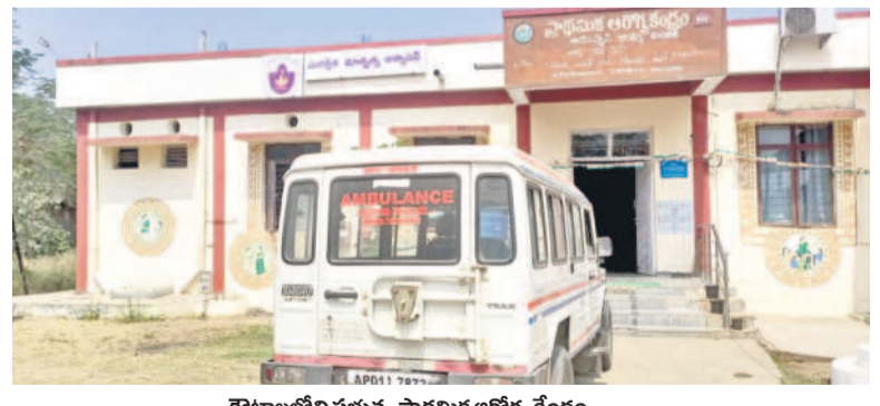
కొటాలలోని ప్రభుత్వ ప్రాథమిక ఆరోగ్య కేంద్రం