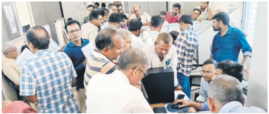
మంచిర్యాల కార్పొరేషన్ కార్యాలయంలో బారులు తీరిన ఎలెక్షన్ల దరఖాస్తు దారులు