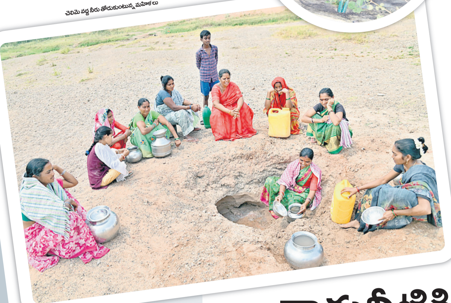
చెలిమె వద్ద నీరు తోడుకుంటున్న మహిళలు

సంఖ్యలో తమ దరఖాస్తులు పరిష్కరించుకోవడానికి తరలివస్తున్నారు. అయితే ఇందుకు సరచుగా సిబ్బంది లేకపోవడం, ఉన్న సిబ్బందిపై అధిక భారం పడడం, దీనికి తోడు తరచూ సర్వే డౌన్ అవడంలాంటి సమస్యలు ఇబ్బందులకు గురిచేస్తున్నాయి. కార్పొరేషన్ గా ఏర్పడకముందు మంచిర్యాల మున్సిపాలిటీలో పాటు నర్సారా మున్సిపాలిటీ, హజీపూర్ మండలంలోని వేంపల్లి, ముల్కల, గుడిపేట, నర్సింపూర్, రాపల్లి, పోచంపాడి, నంనూర్ గ్రామపంచాయితీ పరిధిలో ప్లాట్లు కొనుగోలు చేసిన వేదాది మంది 2020 సంవత్సరంలో రూ. వెయ్యి చెల్లించి ఎలెక్షన్ల కోసం దరఖాస్తు చేసుకున్నారు. ఈ ప్రాంతాలన్నీ నూతనంగా ఏర్పడిన మంచిర్యాల మున్సిపల్ కార్పొరేషన్ లో కలవడంతో ఇప్పుడు వీరంతా ఇక్కడకు తమ దరఖాస్తులను పట్టుకొని వస్తున్నారు. ఎలెక్షన్ల కోసం 2020 సంవత్సరంలో మంచిర్యాలలో పాటు నర్సారా మున్సిపాలిటీ, ప్రస్తుతం కార్పొరేషన్ లో విలీనమయిన గ్రామపంచాయితీల పరిధిలో వేల సంఖ్యలో దరఖాస్తులు చేసుకున్నారు. వీలన్నింటినీ నిర్ణీత గడువులో తీర్చి ఇబ్బందులు పడుతున్నాయి. వేలలో దరఖాస్తులు వచ్చినప్పటికీ వందల్లో మాత్రమే ఎలెక్షన్ల పూర్తిచేశారు. గడువులోగా పూర్తి స్థాయిలో ఎలెక్షన్ల పూర్తిచేయడం ఎలాగూ సాధ్యపడదని, అందుకే ప్రభుత్వం గడువు పెంచుతుందని వలుపురు భావిస్తున్నారు.