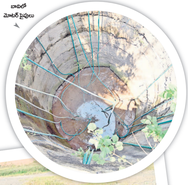
బావిలో మోటర్ పైపులు