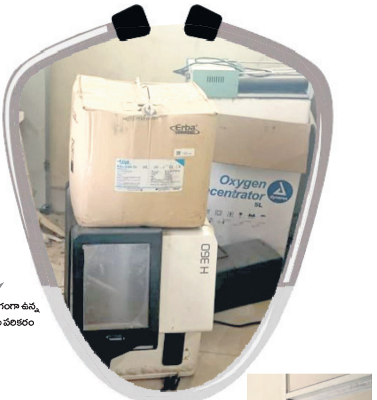
నిరుపయోగంగా ఉన్న రక్త పరీక్షల పరికరం