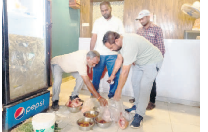
ఆదిలాబాద్ పట్టణంలో హోటల్ లో తనిఖీ చేస్తున్న మున్సిపల్ అధికారులు