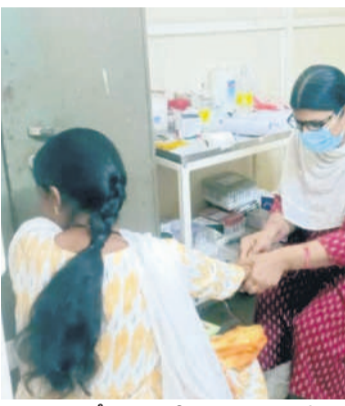
ల్యాబ్ టెస్ట్ చేయని లేక గొట్టే నుంచి పరీక్షల కోసం రక్తం సేకరిస్తున్న స్టాఫ్ నర్స్

బేల, మార్చి 28 : గత బీఆర్ఎస్ సర్కారు హయాంలో మొదలైన వైద్య సేవలందించిన ప్రభుత్వ దవాఖానలు ప్రస్తుతం కాంగ్రెస్ ప్రభుత్వ హయాంలో 'నేను రాను.. బిడ్డే సర్కార్' దవాఖాన'కు అనే పరిస్థితికి వచ్చాయిని ప్రజల నుంచి విమర్శలు వెల్లువెత్తుతున్నాయి. ఇందుకు నిదర్శనంగా బేల ప్రభుత్వ దవాఖాన నిలువల్పందని చెప్పవచ్చు. దవాఖానలో వైద్యులు కొరత, సరైన మందులు లేక, ల్యాబ్ టెస్టులు లేక రోగులు ఇబ్బంది పడుతున్నారు. దీంతో ప్రైవేట్ కు వెళ్లాలిని నెలకొన్నదని మండిపడుతున్నారు. మరో వైపు బీఆర్ఎస్ ప్రభుత్వ హయాంలో మంజూరు చేసిన పీహెచ్ఎస్ నూతన భవనం నిర్మాణం పూర్తయినప్పటికీ అందుబాటులోకి తెరవావడంతో ఐటీఐ భవనంలోనే ఆరకొర వనతుల మద్దతు కొనసాగుతున్నది. బేల మండలంలోని 52 గ్రామాలకు ఉన్న ఒక్క దవాఖానలోనూ సరైన సదుపాయాలు లేక పోతే పరీక్షింపి ఏమిటని ప్రజలు ఆవేదన వ్యక్తం చేస్తున్నారు. ఇటీవల రాత్రి సమయంలో పులిబీ నొప్పులతో వచ్చిన నిండు గొట్టే పట్ల అవస్థలను చూసి దవాఖాన అంటేనే ఇంకే పరీక్షింపి వచ్చిందని విమర్శలు వస్తున్నాయి.