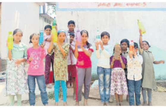
ఇంటి నుంచి తెచ్చుకున్న నాటి బాటిళ్లను చూపిస్తున్న విద్యార్థులు

తాంసి, మార్చి 28 : ఆదిలాబాద్ మున్సిపాలిటీ పరిధిలోని రాంపూర్ ప్రాథమిక పాఠశాలలో విద్యార్థులు తాగునీటి కోసం తీవ్ర ఇబ్బంది పడుతున్నారు. పాఠశాలలో ఉన్న బోరుబావి అడుగంటింది. పాఠశాల ఆవరణలోనే మిషన్ భగదత్ బ్యాంక్ ఉన్నప్పటికీ, నీటి సరఫరా లేక పోవడంతో ఇంటి నుంచి బాటిళ్లలో నీటి తెచ్చుకుంటున్నారు. ఇప్పటికైనా అధికారులు స్పందించి పాఠశాలలో తాగునీటిని అందుబాటులో ఉంచాలని విద్యార్థుల తల్లిదండ్రులు కోరుతున్నారు.