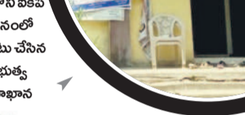
బేలలోని ఐటీఐ భవనంలో ఏర్పాటు చేసిన ప్రభుత్వ దవాఖాన

నికి 35 కిలో మీటర్ల దూరంలో ఉన్న డి.హెచ్.ఎస్.కి ప్రతి రోజూ 100 పైగా రోగులు వస్తుంటారు. అందులో 20 నుంచి 22 మందికి దవాఖానలో అడ్మిట్ చేసుకొని చికిత్స అందించాల్సి వస్తుంది. కానీ ఇక్కడ సరిపడా వైద్యులు, సిబ్బంది లేక పోవడంతో మొదలైన వైద్యం అందడం లేదని రోగులు అంటున్నారు. ఉన్న డాక్టర్లు సరైన వాటికి బయట పరీక్షలు చేయించుకోవాలని సిబ్బంది చెబుతున్నారు. కొందరికి మాత్రం విధిల్లో ఉన్న స్టాఫ్ సర్దులే రక్త పరీక్షల కోసం బ్లడ్ సాంపిల్స్ సేకరించి జిల్లా కేంద్రానికి పంపిస్తున్నారు. ఆ పరీక్షలు రిపోర్ట్ రావడానికి