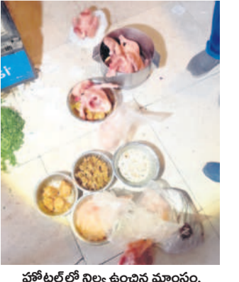
హోటల్ లో నిల్వ ఉంచిన మాంసం, ఇతర అవశేషదాగ్ధాలు

ఆదిలాబాద్, మార్చి 28 (సమస్య తెలంగాణ) : రోజుల తరబడి నిల్వ చేసిన మాంసం, కిచెన్ అవశేషాలతో బొద్దింకలు తిరిగి దృశ్యమై ఆదిలాబాద్ పట్టణంలోని హోటళ్లలో మున్సిపల్ శానిటరీ విభాగం అధికారుల తనిఖీలో వెలుగులోకి వచ్చాయి. ఆదిలాబాద్ పట్టణంలో శుక్రవారం మామ్స్ హోటల్ తోపాటు వెంకటేశ్వర స్వీట్ హౌస్ లో మున్సిపల్ శానిటరీ ఇన్స్పెక్టర్ల సందర్శన, శంకర్ ఆహారశాలలో తనిఖీలు చేశారు. హోటళ్లలో పారిశుధ్యం అప్రవృత్తంగా ఉండడంపై నిర్వాహకులపై ఆగ్రహం వ్యక్తం చేశారు. హోటళ్లలో ఫ్రీజర్ లో చాలా రోజులుగా నిల్వ ఉంచిన బిజినెస్, మటన్, చేపల మాంసాన్ని గుర్తించారు. వంటశాలలో ఆహారంపై బొద్దింకలు తిరుగుతున్నాయని ఆరోపించారు. మినాయ్ కెక్ లోని వెంకటేశ్వర స్వీట్ హౌస్ లో ఫ్రీజర్ లో చాలా రోజుల క్రితం తయారు చేసిన స్వీట్స్ నిల్వ ఉంచినట్లు అధికారులు గుర్తించారు. హోటల్