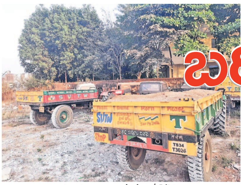
ఇసుకను అక్రమంగా తరలించడంతో పోలీసులు సీజ్ చేసిన ట్రాక్టర్లు

వికారాబాద్, మార్చి 28 (నమస్తే తెలంగాణ): జిల్లాలోని తాండూరు నియోజకవర్గంలో ఇసుక మాఫియా బరితెగిస్తున్నది. స్థానిక కాంగ్రెస్ పార్టీ ముఖ్య నేత అండతోనే రెచ్చిపోతున్నారనే ఆరోపణలున్నాయి. యాలాల, తాండూరు మండలాల మీదుగా వెళ్లే కాక్రూని నది ద్వారా ఇసుక అక్రమ రవాణా అడ్డూఅడ్డు లేకుండా సాగుతున్నది. అడ్డుకట్ట వేయాల్సిన పోలీస్, రెవెన్యూ, మైనింగ్ శాఖల అధికారులు అధికార పార్టీ నాయకుల ఒత్తిడిలకు తలొగ్గి వారు చెప్పినట్లు విడుదలైనారనే ఆరోపణలున్నాయి. మూడు రోజుల కిందట తాండూరు మండలంలోని వీరశెట్టిపల్లికి చెందిన ఓ వ్యక్తి కాక్రూని నది నుంచి కొందరు రాత్రి సమయంలో ట్రాక్టర్ ద్వారా ఇసుకను అక్రమంగా తరలి