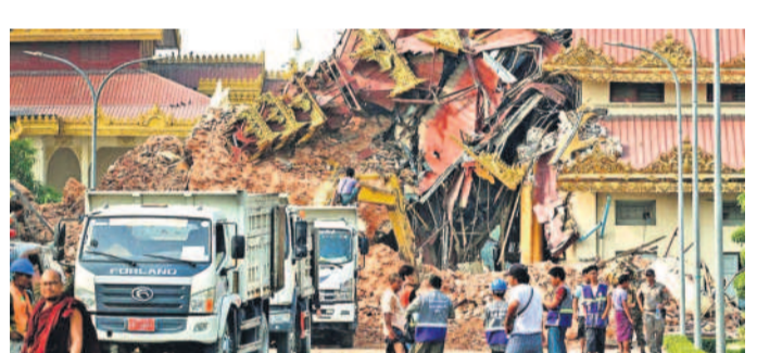
మయన్మార్ లో తాజా భూకంపం దాటికి కుప్పకూరిన ఓ భవనం

న్యూఢిల్లీ: మహారాష్ట్రలోని పలు జిల్లాల్లో దయరీయా (అభిసారం) విజృంభిస్తున్నది. జలోన్, పుణె, రాయగడ, సతారా, సాంగ్లి, నందుద్గర్, కొల్హాపూర్, రత్నగిరి జిల్లాల్లో దయరీయా కేసుల సంఖ్య అమాహ్యంగా పెరిగింది. ఇందుకు గల కారణంపై అధ్యయనం చేసిన ఐరాస సంస్థ 'యూనిసెప్' కీలక వివరాలను వెల్లడించింది. ప్రధానంగా స్వచ్ఛ భారత్ మిషన్ కింద సాగిన కార్యక్రమాలలో సమస్య నెలకొన్న విషయాన్ని గణాంకాలతో సహా బయటపెట్టింది. సరైన నాణ్యత, నిర్వహణ లేకుండా సామాజిక మరుగుదొడ్డు కట్టడం, గ్రామాల్లో స్వచ్ఛ భారత్ కింద సెక్టిక్ ట్యూంకిల నిర్మాణాలు అలాగే ఉండటం వల్ల మరుదల దానికి కారణమై ఉండొచ్చునని పేర్కొన్నది. రాష్ట్రంలో 2022-2024 వర్షాకాలంలో కనీసం 10 శాతం వరకు మిషన్ కింద అత్యంత నాసిరకంగా నిర్వహించిన సామాజిక మరుగుదొడ్డు వ్యాధులు ప్రజలదానికి ముఖ్య కారణమని 'యూనిసెప్' నివేదిక పేర్కొంది. గ్రామాల్లో సెక్టిక్ ట్యూంకిలలో మలం పొలిస్తూ పురుగు బయటకు రావడం, వ్యాధులు ప్రజలదానికి దారి తీసేందుకు యూనిసెప్ ముందే ఇవ్ చార్జీ కలిగి చెప్పారు.