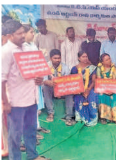
నిరాహార దీక్ష చేస్తున్న నిర్మాణ కార్మికులు