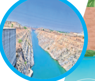
అంజనేయ బజార్ (నార్కట్ పల్లి) నుంచి వీరాంజనేయ (ఏదుల) బజార్ వరకు నీళ్లు తరలివేసే హెడ్ రెగ్యులేటర్

ఈ కొద్దిపాటి పని పూర్తి చేస్తే కృష్ణా జలాలు శ్రీశైలం నుంచి కురుమూర్తిరాయ్ బజార్ వరకు (కరవెన) తరలివెళ్తాయి. ఆ మేరకు పనులు చేసే కేసీఆర్ హయాంలోనే పూర్తయ్యాయి.