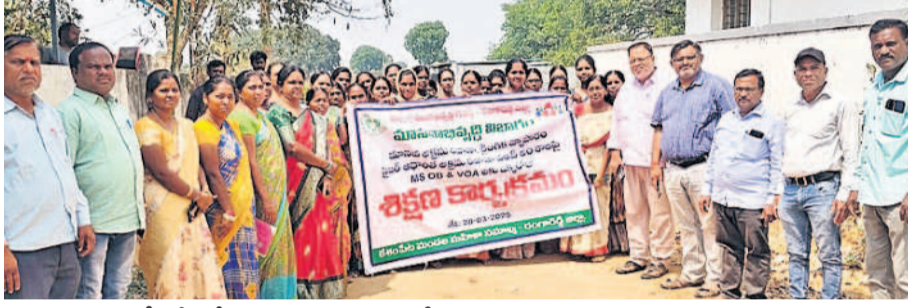
కేశంపేటలో మానవ అక్రమ రవాణాపై ర్యాలీ నిర్వహిస్తున్న మహిళా సమాఖ్య సిబ్బంది, మహిళలు