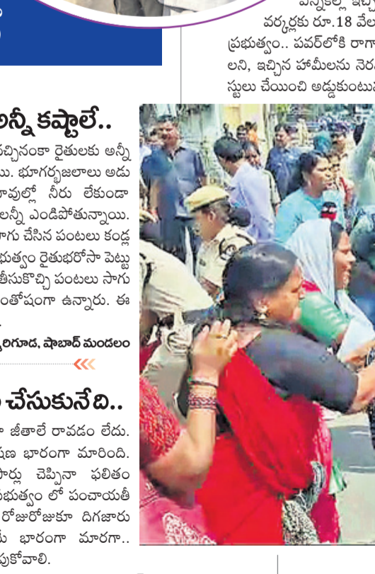
నిరసన తెలుపుతున్న ఆశ వర్కర్లను అరెస్టు చేస్తున్న పోలీసులు (ఫైల్)