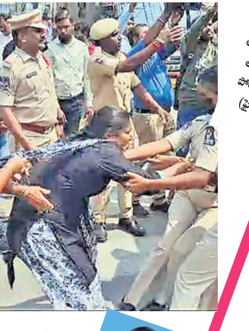
నిరసన తెలుపుతున్న ఆశ వర్కర్లను అరెస్టు చేస్తున్న పోలీసులు (ఫైల్)

ఎన్నికల్లో ఇచ్చిన హామీలను కాంగ్రెస్ సర్కార్ అమలు చేయకపోవడంతో ఆశ వర్కర్ల ఆశలు ఆవిరయ్యాయి. ఆశ వర్కర్లకు రూ. 18 వేల ఫిక్స్డ్ వేతనం, ఈఎన్ఐ, పీఎస్ సౌకర్యం కల్పిస్తామని అసెంబ్లీ ఎన్నికల్లో హామీ ఇచ్చిన కాంగ్రెస్ ప్రభుత్వం.. పవర్లోకి రాగానే చేతులెత్తేయడంతో వారి బాధలు వర్షవారితో మారాయి. తమ సమస్యలు పరిష్కరించాలని, ఇచ్చిన హామీలను నెరవేర్చాలని ఏమైనా నిరసన కార్యక్రమాలు చేపడితే ప్రభుత్వం పోలీసులతో ఎక్కడిక్కడ అరెస్టులు చేయించి అడ్డుకుంటున్నదని మండిపడ్డారు.