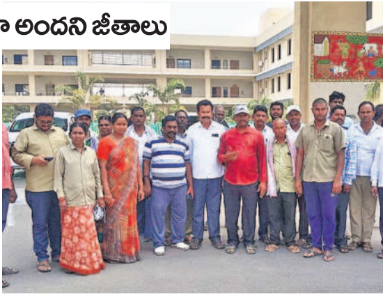
కల్లెచేట్ల ఎదుట నిరసన తెలుపుతున్న పంచాయతీ కార్మికులు (ఫైల్)

గ్రామాలను పరిశుభ్రం చేసే పంచాయతీ కార్మికులకు కొన్ని నెలలుగా జీతాలు రాకపోవడంతో వారు తీవ్ర అవస్థలు పడుతున్నారు. గత కేసీఆర్ ప్రభుత్వం గ్రామాలను స్వచ్ఛం గా మార్చేందుకు పల్లెప్రగతి కార్యక్రమానికి శ్రీకారం చుట్టింది. అందుకోసం గ్రామాల్లో పంచాయతీ సిబ్బందిని నియమించింది. అప్పట్లో వారికి ప్రతినెలా నెలకు గ్రామాల జీతాలు అందడంతో వారింటి ఇబ్బందులు లేకుండా. కానీ, ప్రస్తుత రేవంట్ సర్కార్ గత నాలుగు నెలలుగా జీతాలు అందక పూట గడవడమే కష్టంగా మా రిందని వారు ఆవేదన వ్యక్తం చేస్తున్నారు. ఈ పండుగకూ పన్నులుండాలని పరిస్థితే వచ్చిందని వాపోతున్నారు.