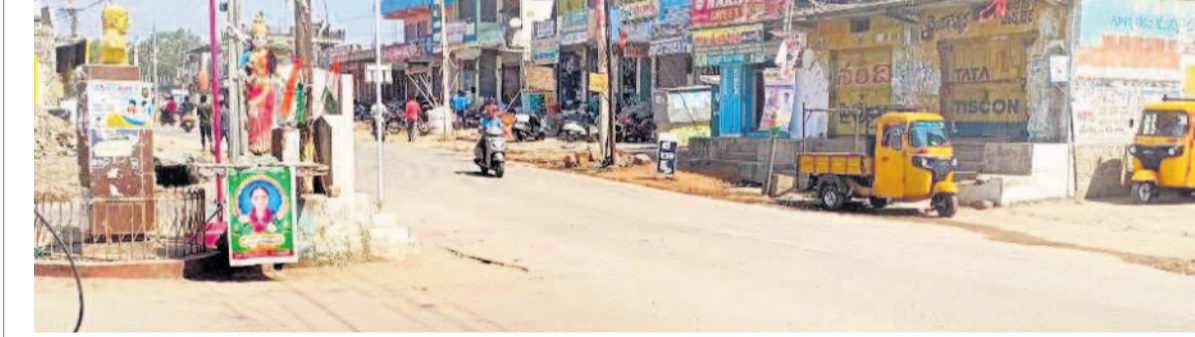
తెలంగాణ తల్లి చారిత్రాత్మక నిర్మాణాన్ని దర్శనమిస్తున్న రోడ్డు