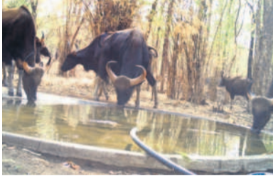
సానర్ పిట్లలో నీటిని తాగుతున్న అడవి బల్లెలు