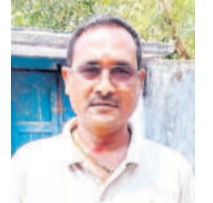
- తిమ్మి బాసెట్, నర్సూర్