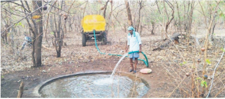
ట్యాంకర్ ద్వారా నీటిని నింపుతున్న సిబ్బంది

ఖానాపూర్ టౌన్, మార్చి 30 : వేసవిలో తాగునీటికై వన్యప్రాణులు మైదాన ప్రాంతాలకు వస్తున్న నేపథ్యంలో వాటి రక్షణకు అటవీశాఖ అధ్యక్షులలో పట్టణ చర్యలు చేపట్టారు. ఐదారు నెలలుగా వర్షాలు లేక అటవీ ప్రాంతంలోని వాగులు, వంకలు, నీటి జాలు గుంతలన్నీ వట్టిపోయాయి. దీంతో అడవి జంతువులకు తాగునీరు దొరకడం కష్టంగా మారింది. నీళ్ల కోసం ఇటీవల దుప్పలు మైదాన ప్రాంతాలకు వచ్చి కుక్కల దాడిలో గాయపడిన ఘటనలు సైతం చోటు చేసుకున్నాయి. గతంలో అడవి జంతువుల దాహార్తిని