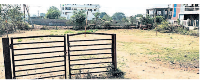
విలేజ్ సమూహ మొక్కల పెంపకం కేంద్రంలో ఏర్పాటు చేసిన వాల్ బాల్ కోర్టు