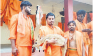
కుక్కల దాడిలో గాయపడిన దుప్పిని కాపాడిన యువకులు

విద్యుత్ నెలకొంటున్నది. సానర్ పిట్ల పరిసర ప్రాంతాల్లో సీసీ కెమెరాలు ఏర్పాటు చేసి నీరు తాగేందుకు వచ్చే పక్షులు, జంతువుల కదలికలను కెమెరాల్లో నమోదు చేస్తున్నారు. ఆ కెమెరాల నుంచి ఫోటోలను డౌన్ చేసుకుని వాటి బాగోగులు, ఆరోగ్య పరిస్థితులను అంచనా వేస్తున్నారు. ముఖ్యంగా అడవిలో తోడేళ్లు, జింకలు, దుప్పలు, కుందేళ్లు, కొండ గొర్రెలు ఇతర వన్యప్రాణులు ఉన్నట్లు అటవీశాఖ అధికారులు గుర్తించారు.