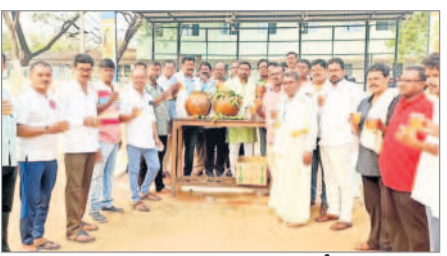
మందమర్ర : ఊరిలో పచ్చడి పంపిణీ చేస్తున్న మున్నూరు కాపు సంఘం నాయకులు