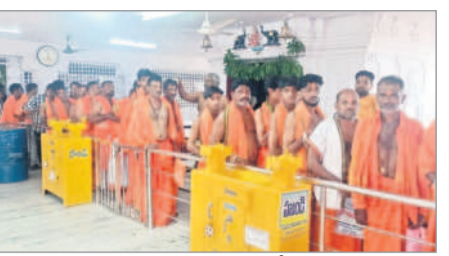
దండేపల్లి : గూడెం ఆలయంలో స్వామివారిని దర్శించుకుంటున్న భక్తులు