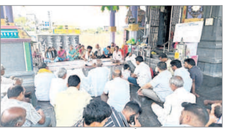
జైపూర్ : వేంకటేశ్వర ఆలయంలో పంచాంగ శ్రవణాన్ని వింటున్న భక్తులు