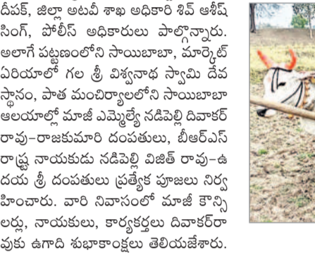
కొటాల : వ్యవసాయ పనులు ప్రారంభిస్తున్న రైతులు