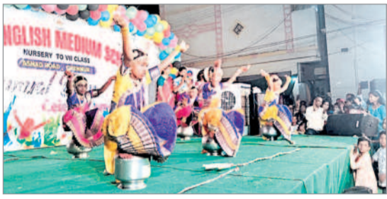
స్వతంత్ర చేస్తున్న విద్యార్థులు