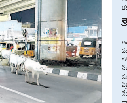
మందమర్ర పాతబస్టాండ్లో రోడ్డుపై సంచరిస్తున్న పశువులు