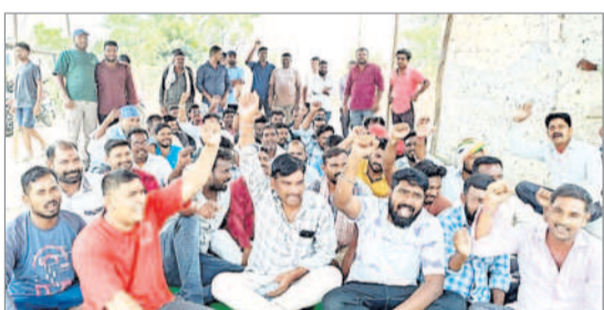
ఇందారంఖని ఓసినై సమ్మెలో పాల్గొన్న వోల్టేజీ డైవర్లు

జైపూర్, మార్చి 30 : చాలీచాలని వేతనాలతో పని చేస్తున్నామని, హైవారి కమిటీ వేతనాలు చెల్లించాలని ఇందారంఖని ఓసినైకాన్సెస్ గని వరాహ కంపెనీలో పని చేస్తున్న వోల్టేజీ డైవర్లు గని వరాహ కంపెనీ వోల్టేజీ డైవర్లు ఆదివారం నుంచి విధులు బహిష్కరించి శాంతియుత సమ్మెలో పాల్గొన్నారు. ఈ సందర్భంగా వారు మాట్లాడుతూ... తమ సమస్యలను వివరించే కంపెనీ యాజమాన్యానికి వినతి పత్రం ఇచ్చినా పట్టించుకోవడంతో సమ్మెలో పాల్గొన్నట్లు తెలిపారు. ఇప్పటికే అనేకమార్లు విన్నవించుకున్నా కంపెనీ యాజమాన్యం స్పందించడం లేదని పేర్కొన్నారు. చాలీచాలని వేతనాలతో కుటుంబ పోషణ ఇబ్బందవుతున్నదన్నారు.