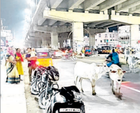
మందమర్ర పాతబస్టాండ్లో రోడ్డుపై సంచరిస్తున్న పశువులు

డిఫిట్ చేశారు. అలాగే వాహనదారులు తీవ్ర గాయాలతో పాలయ్యారు. అలాగే దంపతులు బైక్పై వెళ్తుండగా, పాతబస్టాండ్ వోరస్టాలో పశువులు అడ్డురావడంతో త్వరితగతిన ప్రమాదం నుంచి బయటపడ్డారు. పశువులను రోడ్డుకి వదలొద్దని, లేకపోతే బంజరు దొడ్లకు తరలించడంతోపాటు చర్యలు తీసుకుంటామని గతలోనే మున్సిపల్ అధికారులు యజమానులను హెచ్చరించారు. అయినా ఎవరూ పట్టించుకోవడం లేదు. వాహనదారులు ఆందోళనకు గురవుతున్నారు. సంబంధిత అధికారులు తరచు చర్యలు తీసుకొని రోడ్డుకి రాకుండా నివారించాలని కోరుతున్నారు.