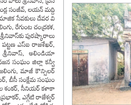
శిథిలవస్తుకు వేసిన పాఠశాల భవనాన్ని కూల్చి వేస్తున్న కూలీలు

చెన్నూర్, మార్చి 30 : తాగునీటి సరఫరా ఓవర్ హెడ్ ట్యాంక్ నిర్మాణం కోసం అధికారులు ప్రభుత్వ ఉన్నత పాఠశాల భవనాన్ని కూల్చివేస్తున్నారు. అమ్మత్తి పథకం ద్వారా చెన్నూర్ పట్టణానికి ఓవర్ హెడ్ వాటర్ ట్యాంకులు మంజూరయ్యాయి. ఇందులో భాగంగా పట్టణంలోని పాత బస్టాండ్ ఏరియాలో ఒకటి నిర్మించనున్నారు. అయితే దాని నిర్మాణానికి అవసరమైన ప్రభుత్వ స్థలం లేదావడంతో ప్రభుత్వ ఉన్నత పాఠశాల ఆవరణలో నిర్మించాలని అధికారులు భావించారు. ఇందుకు శిథిల