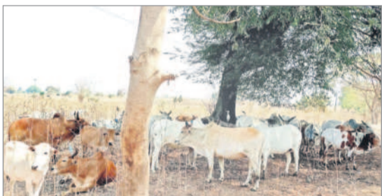
చెట్లు నీడలో నీడతీరుతున్న పశువులు

కెరమెరి, మార్చి 30 : మండలకున్న ఎండలకు ప్రజలతో పాటు పశువులు ఇబ్బందులకు గురవుతున్నాయి. ఒక్కసారిగా పెరిగిన ఉష్ణోగ్రతలతో ప్రజలు బయటికి వెళ్లేందుకు సాహసించడం లేదు. అత్యవసర పనులుంటే తప్ప ఇంట్లోనే ఉంటున్నారు. ఇక ముగ్గులివల పరిస్థితి దయనీయంగా మారింది. మధ్యాహ్నం 12 వాటితో పశువులు చెట్ల కింద చేరి నీడతీరుతున్నాయి. ఆదియం ఎండ తీవ్రతకు తట్టుకోలేక కొన్ని పశువులు ఇలా చింత చెట్టును ఆగ్రయించి ఉపశమనం పొందాయి.