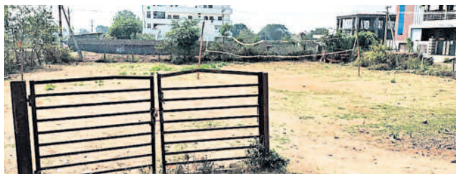
విలేజ్ సమగ్రి మొక్కల పెంపకం కేంద్రంలో ఏర్పాటు చేసిన వాటిబాల్ కోర్సు