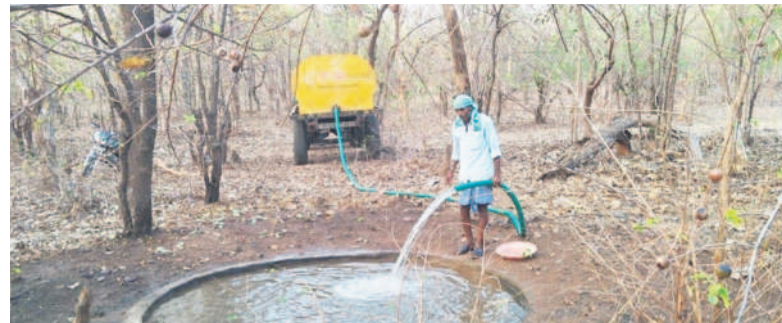
ట్యాంకర్ ద్వారా నీటిని నింపుతున్న సిబ్బంది

ఖానాపూర్ టౌన్, మార్చి 30 : వేసవిలో తాగునీటికై వన్యప్రాణులు మైదాన ప్రాంతాలకు వస్తున్న సేవ ధ్వంసం వాటి రక్షణకు అటవీశాఖ అధ్యక్షులతో పట్టణ చర్యలు చేపట్టారు. ఐదారు నెలలుగా వర్షాలు లేక అటవీ ప్రాంతంలోని వాగులు, వంకలు, నీటి జాలు గుంతలన్నీ వట్టిపోయాయి. దీంతో అడవి జంతువులకు తాగునీరు దొరకడం కష్టంగా మారింది. నీళ్ల కోసం ఇటీవల దుప్పలు మైదాన ప్రాంతాలకు వచ్చి కుక్కల దాడిలో గాయపడిన ఘటనలు సైతం చోటు చేసుకున్నాయి. గతంలో అడవి జంతువుల దాహార్తిని