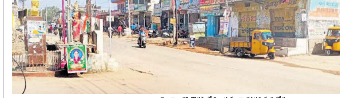
తెలంగాణ తల్లి చారిత్రాత్మక నిర్మాణాన్ని దగ్ధం చేస్తున్న రోడ్డు

రేణి బోజులూ ఎండలు మండిపోతున్నాయి. అదివారం ఉష్ణోగ్రత అధికంగా ఉండడంతో ఖానాపూర్ పట్టణంలోని తెలంగాణ తల్లి, ఎస్సీల చారిత్రాత్మక నిర్మాణాన్ని దగ్ధం చేశారు. నిర్మాణం జనంతో బాజులూ ఉండే ప్రధాన కూడళ్లు మ్యాగ్నెట్ 12 నుంచి సాయంత్రం 4 గంటల వరకు ప్రజలు బయటకు రాకపోవడంతో బోసిపోయి కనిపించాయి. ఎండ వేడిగా భరించలేక ప్రజలు, వ్యాపారులు సమతపాతమవుతున్నారు. గరిష్టంగా 42 డిగ్రీల ఉష్ణోగ్రత నమోదైంది. ప్రజలు వడ దెబ్బ తలకలూ తగిన జాగ్రత్తలు పాటించాలని వైద్యధికారులు సూచిస్తున్నారు.