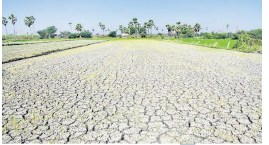
కరీంనగర్ రూరల్ మండలంలో సాగునీరు లేక బీటలు వారిని పొలం

5 కరీంనగర్, సోమవారం 31 మార్చి 2025 KARIMNAGAR