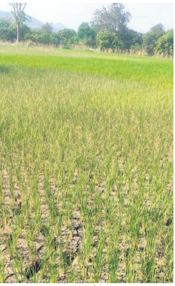
ఎండపల్లి మండల కేంద్రంలో ఎండిపోయిన పొలం

ఎస్సారెస్సీ జోన్-2కు వచ్చే నెల 2న.. జోన్-1కు 9న తడులు నిలిపివేత