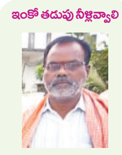
ఇంకో తదుపరి సీక్స్ వ్యాధి