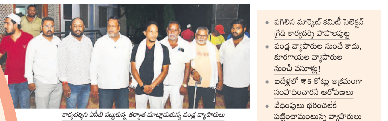
కార్యదర్శిని ఏసీబీ పట్టుకున్న తర్వాత మాట్లాడుతున్న పండ్ల వ్యాపారులు