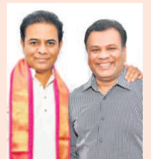
బీఆర్ఎస్ వర్కర్ల ప్రెసిడెంట్ కేటీఆర్ ను కలిసిన పార్టీ ఎన్నిక గ్లోబల్ కోఆర్డినేటర్ మహేశ్ బిగాల

చెప్పారు. బీఆర్ఎస్ నిర్వహణలో ఉన్నప్పుడు అన్ని పంటలు మేం కోవాలని సూచించారు. పప్పు లింకలు విరివిగా పంపించాలని చెప్పారు. సీటును కాపాడకోవాలని ఆయన జాగ్రత్తగా ఉండాలని స్పష్టం చేశారు. వార్షిక మెంబర్ నుంచి ఎమ్మెల్యే వరకు ఏ ఎన్నిక పాలనాధిపతి అయిన ముఖ్యమంత్రి రేవంత్ చెప్పారు. బీఆర్ఎస్ నిర్వహణలో ఉన్నప్పుడు అన్ని పంటలు మేం కోవాలని సూచించారు. పప్పు లింకలు విరివిగా పంపించాలని చెప్పారు. సీటును కాపాడకోవాలని ఆయన జాగ్రత్తగా ఉండాలని స్పష్టం చేశారు. వార్షిక మెంబర్ నుంచి ఎమ్మెల్యే వరకు ఏ ఎన్నిక పాలనాధిపతి అయిన ముఖ్యమంత్రి రేవంత్ చెప్పారు.