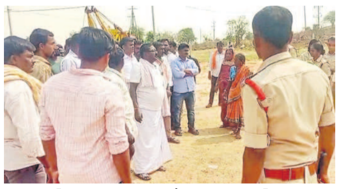
ఆయిల్ పాం ఫ్యాక్టరీ నిర్మాణాన్ని ప్రతిరోధిస్తున్న ప్రజలు, కాంగ్రెస్ కార్యకర్తలు

కాల్కొని తింటున్నాడు. దీంతో రెండో జులుగా కాళ్లు లాగడం ఒక్కంతా సీరసించిపోవడం లాంటి సంతాపాలు కనిపిస్తున్నాయని కుటుంబ సభ్యులకు తెలిపారు. మేల్, ఫివేల్ మక్కజొన్న కంకులు తినడం వల్లే ఇలా జరుగుతుందని తెలియక వాటిని తినడం ఆపలేదు. దీంతో ఆదివారం ఉదయం తీవ్ర అన్యస్తకకు గురికావడంతో కుటుంబ సభ్యులు దవాఖానకు తరలిస్తే డాక్టర్లు మరణం మృతిచెందారు.