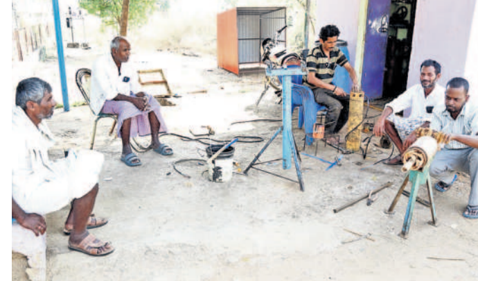
పుల్లల మండలం కోడూరులో బోరు మోటర్ మరమ్మత్తు చేయించుకుంటున్న రైతులు

బోర్లు పోస్ట్ లేవు.. పంటలు పండుతలేవు • సాగుకు ట్యాంకర్ సేవ దిక్కు • పొట్టికొచ్చిన పంటలను కాపాడుకునేందుకు • లన్నదాతల విశ్వప్రయత్నాలు • రంగారెడ్డి జిల్లాలో సాగునీటికి తప్పని తిప్పలు రంగారెడ్డి, నమస్తే తెలంగాణ : రంగారెడ్డి జిల్లాలో సాగునీటి కోసం అన్నదాతలు అరిగిన పడుతున్నారు. మరో 15 రోజుల్లో పంటలు చేతికొస్తాయనుకునే సమయంలో బోర్లు ఎండిపోవడంతో పంట పొలాలు ఎక్కడిక్కడెక్కడెక్కడ ఎండిపోతున్నాయి. వెల్లుబిడులు పెట్టి సాగుచేసే పంటలు కండ్లముందే ఎండిపోతుంటే తట్టుకోలేని రైతులు ట్యాంకర్ల ద్వారా సాగునీటిని కొనుగోలు చేసి పొలాలను సాగు చేస్తున్నారు. ఒక్కో రైతు రోజుకు నాలుగు నుంచి ఐదు ట్యాంకర్లను కొనుగోలు చేయాలి అంటున్నారని తెలుస్తోంది. సాగునీటి కోసం రైతుల రాజీవారోగి రూ. 2 వేలు నుంచి రూ. 8 వేల వరకు ఖర్చు చేస్తున్నారు. కాగా, మరొకవైపు రైతులు