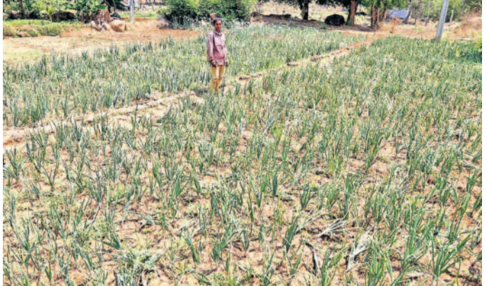
పుల్లల మండలం బస్సాపూర్లో సాగునీరు లేక ఎండిపోయిన ఉల్లిపంట