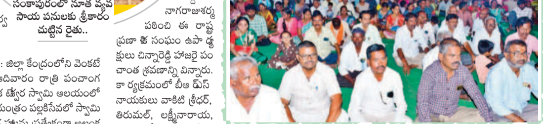
రింబి పూజ కార్యక్రమాల నిర్వహించారు. ఈ పంచాంగ శ్రవణం వినిపించారు.