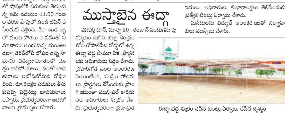
ఈడ్గా వద్ద ముస్తాబైన ఈడ్గా వద్ద సామాజిక ప్రార్థనలకు అధికారులు సిద్ధం చేశారు.

వనపర్తి టౌన్, మార్చి 30 : రంజాన్ పండుగను పురస్కరించుకుంటూ జిల్లా కేంద్రంలోని గోపాలపేట రోడ్డులో ఉన్న ఈడ్గా వద్ద సామాజిక ప్రార్థనలకు అధికారులు సిద్ధం చేశారు. ప్రభుత్వ కళాశాలలో ఉన్న ఈడ్గా వద్ద సామాజిక ప్రార్థనలకు అధికారులు సిద్ధం చేశారు.