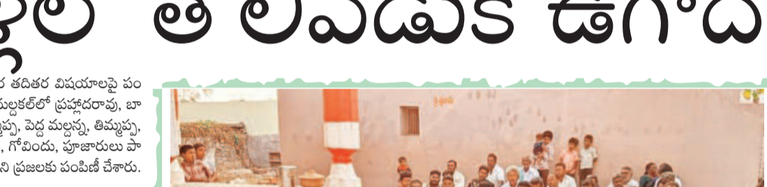
రింబి పూజ కార్యక్రమాల నిర్వహించారు. ఈ పంచాంగ శ్రవణం వినిపించారు.