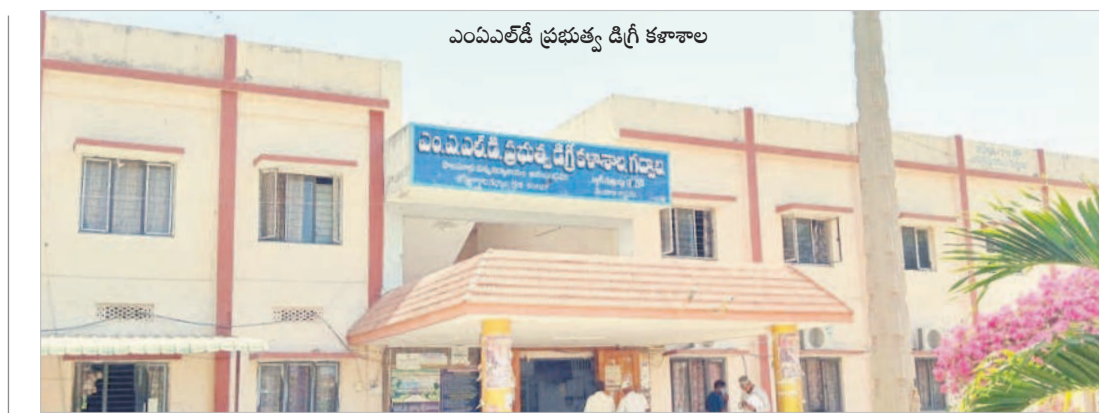
ఎంపీఎల్డీ ప్రభుత్వ డిగ్రీ కళాశాల