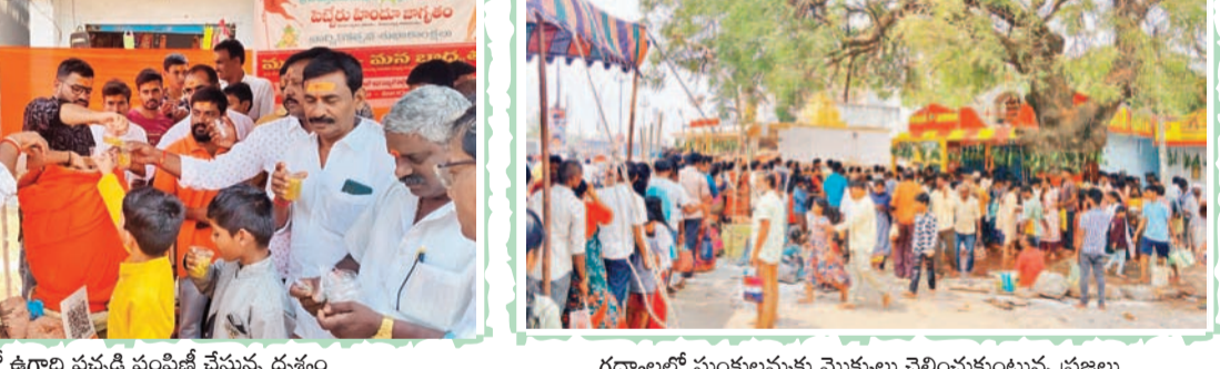
రింబి పూజ కార్యక్రమాల నిర్వహించారు. ఈ పంచాంగ శ్రవణం వినిపించారు.