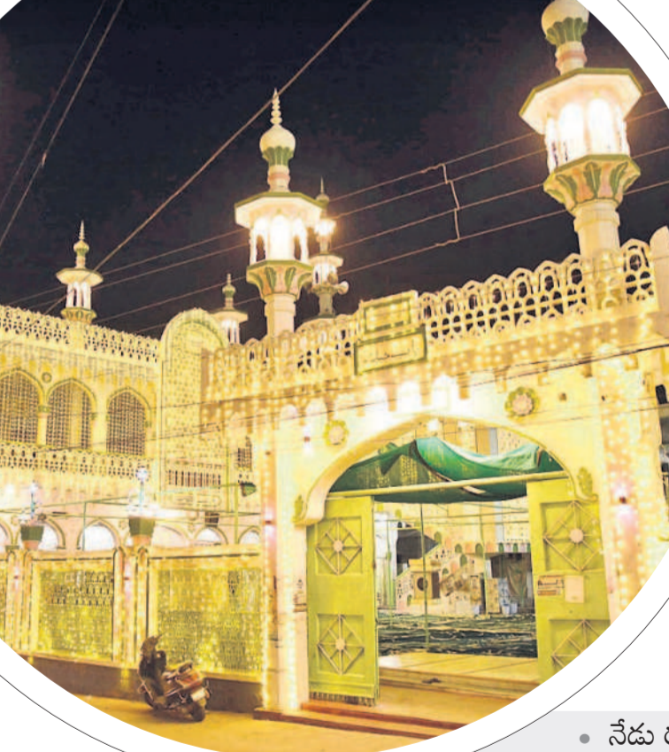
రంజాన్ వేడుకలకు ముస్తాబైన మహబూబ్ నగర్ లోని మదీనా మసీదు

ఇద్దుల్ ఖాన్, మార్చి 30 : ముస్లింల పవిత్రంగా జరుపుకొనే పండుగల్లో రంజాన్ అత్యంత పవిత్రమైనది. ఇస్లామిక్ క్యాలెండర్ ప్రకారం 9వ నెల రంజాన్ మాసం ముగిసి ఆకా శుబ్ లో నెల తుక దర్బన మిగ్గానే పవ్వాల్ నెల ప్రారంభం జరుపుతుంది. పవ్వాల్ మొదటి రోజున ముస్లింలు రంజాన్ (ఆదుల్ ఫిత్) పండుగను జరుగుతారు. రంజాన్ పండుగ సందర్భంగా ముందుగా ఈ ధర్మాలు ముస్తాబు చేసి కొత్త దుస్తులు ధరించి ప్రత్యేక ప్రార్థనలు చేస్తారు. ప్రార్థనల అనంతరం ఒకటి నెకరూ ఆలింగనం చేసుకొంటూ ఈడీ ఉల్ ఫిత్ శుభా కాక్షలు తెలియజేసుకుంటారు. ఇస్లామిక్ క్యాలెండర్ ప్రకారం తొమ్మిదవ నెల రంజాన్ మాసం లోనే పవిత్ర గ్రంథం ఖురాన్ చేపడతారు. రాత్రిళ్లు మసీదులకు వెళ్లి తరావీఫ్ ప్రార్థనలు చేస్తారు. రంజాన్ నెలలో 27వ రోజు రాత్రి ప్రత్యేకంగా షహీద్ దినం జరుపుతారు. ఆ రోజు రాత్రులు ప్రత్యేక ప్రార్థనలు చేస్తూ అల్లాహ్ ను ఆరాధిస్తే పాపాల నుంచి