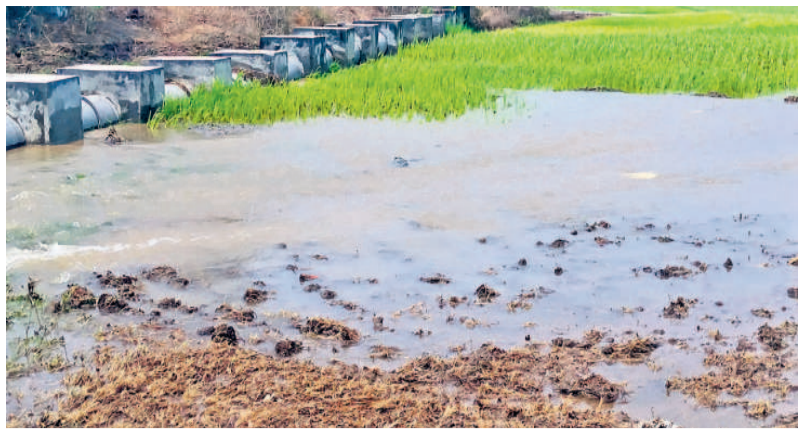
మిషన్ భగదర్ల ప్రైవేట్ల వక్కనే దేవాలం టన్నెల్ లీజ్ ద్వారా వచ్చిన వరి పాలం