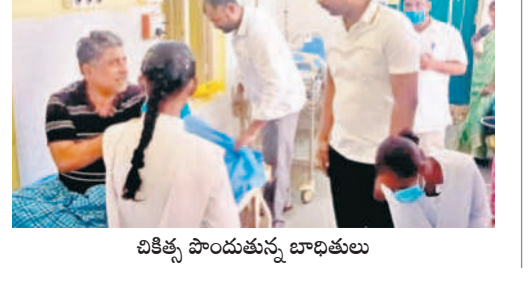
చికిత్స పొందుతున్న బాలితులు