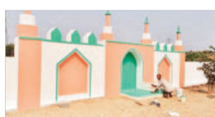
శ్రీపురం రోడ్డులో ముస్లిమైన దర్గాలు

● ముస్లిమైన దర్గాలు నాగర్ కర్నూల్ రూరల్, మార్చి 30: ముస్లింల పవిత్ర రంజానీ మూసం ముగిసింది. అదివారం సాయంత్రం నెలవంక కన్యించడంతో సోమవారం ఈద్-ఉల్-ఫితర్ జరుపుకోవాలని హైదరాబాద్ జామీయా నిజామీయా అరబీక్ యూనివర్సిటీ ద్వారా ప్రకటనలు జారీ చేశారు. డింకో సోమవారం ఈద్గా వచ్చే ప్రత్యేక సమాజ్ కోసం ఏర్పాటు కొనసాగుతున్నాయి.