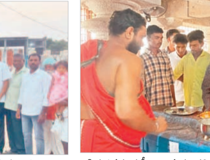
సీరుసనగండ్ల సీతారామచంద్ర స్వామి అలయంలో పూజలు చేస్తున్న భక్తులు