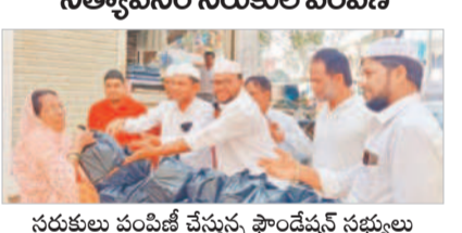
సరుకులు పంపిణీ చేస్తున్న ఫౌండేషన్ సభ్యులు