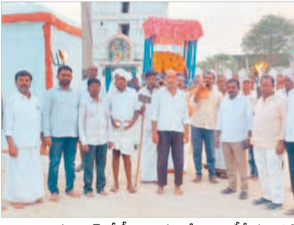
అబ్రూవాద్లో సీతారామచంద్ర స్వామి అలయంలో పూజలు చేస్తున్న భక్తులు

చారకొండలో.. చారకొండ, మార్చి 30: మండలంలోని సీరుసనగండ్ల