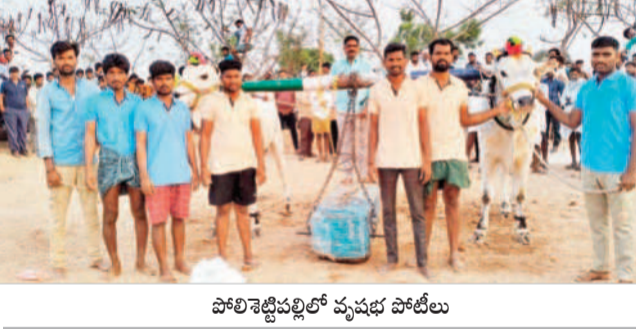
పోలిశెట్టిపల్లిలో వ్యవభ పోటీలు

శారు. ప్రథమ బహుమతి రూ. 25వేలు, ద్వితీయ రూ. 20వేలు, తృతీయ బహుమతి రూ. 15వేలు అందజేశారు. వివిధ గ్రామాల నుంచి రైతులు, తదితరులు పోటీలను తిలకించారు. ఈ పోటీలకు మండలంలోని వివిధ రాజకీయ పార్టీల నాయకులు, రైతులు అధిక సంఖ్యలో పాల్గొన్నారు.