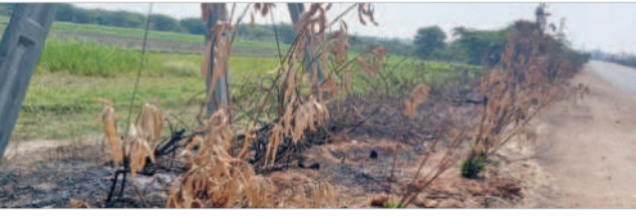
మార్కెట్లో జాతీయ రహదారిపై ఎండిపోయిన మొక్కలు

కల్వకుర్తి రూరల్, మార్చి 30: కేసీఆర్ సర్కారు తెలంగాణను హరిత తెలంగాణగా తీర్చేందుకు గ్రామ గ్రామాల మొక్కలు నాటి పనులను ఎంపిడి, గ్రామాల్లో పలువురు రైతులు తమ పొలాల్లోని చెత్త చెదరాన్ని కాల్చడంతో రోడ్లపై నాటిన మొక్కలకు తాకడంతో అవి అగ్నికి ఆహుతులైపోయాయి. మండలంలోని మార్కెట్ గేట్ సమీపంలో ప్రధాన రహదారిపై రోడ్డుకు ఇరు వైపులా హరిత చరలో నాటిన మొక్కలు