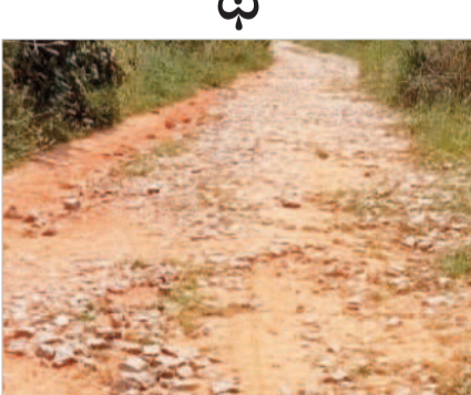
వంకమాతితండాకు వెళ్లే దారి ఇలా..