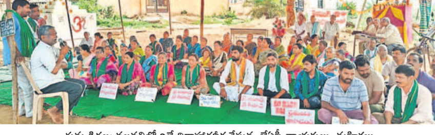
గుమ్మడిపల్లె: నల్లపల్లిలో రిలే నిరాహారదీక్ష చేస్తున్న జేపీసీ నాయకులు, మహిళలు

గుమ్మడిపల్లె, మార్చి 30: రాష్ట్ర ప్రజలంతా ఉగాది పండుగను జరుపుకోవాలంటే ఇక్కడి గ్రామాల ప్రజలు డంపింగ్ యార్డు (ఎంఎస్ డబ్ల్యూ) కు రాష్ట్ర ప్రభుత్వం ఇచ్చిన అనుమతులు రద్దు చేయాలని రిలే నిరాహారదీక్ష చేశారు. ఆదివారం సంగారెడ్డి జిల్లా గుమ్మడిపల్లె మండలం నల్లపల్లి గ్రామ పంచాయతీ పరిధిలోని యార్డులోని సమీపంలో రాంకి సంస్థ నిర్వహిస్తున్న డంపింగ్ యార్డు (ఎంఎస్ డబ్ల్యూ) ను రద్దు చేయాలని నల్లపల్లి, కొత్తపల్లి, ప్యారానగర్ గ్రామాల ప్రజలు 54వ రోజు రిలే నిరాహారదీక్షలో పాల్గొన్నారు. ఈ సందర్భంగా వారు మాట్లాడుతూ 54 రోజులుగా డంపింగ్ యార్డు రద్దు చేయాలని దీక్షలు, ఆందోళనలు చేస్తున్నప్పటికీ ఇప్పటి వరకు రాష్ట్ర పాల