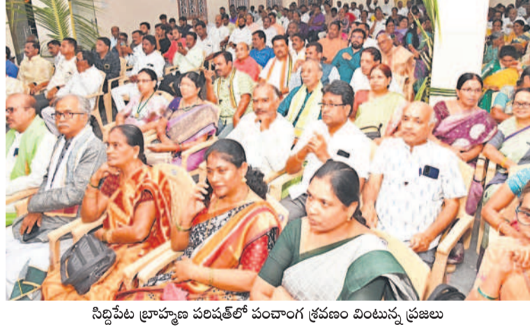
సిద్దిపేట బ్రాహ్మణ పరిషత్ లో పంచాంగ శ్రవణం వింటున్న ప్రజలు