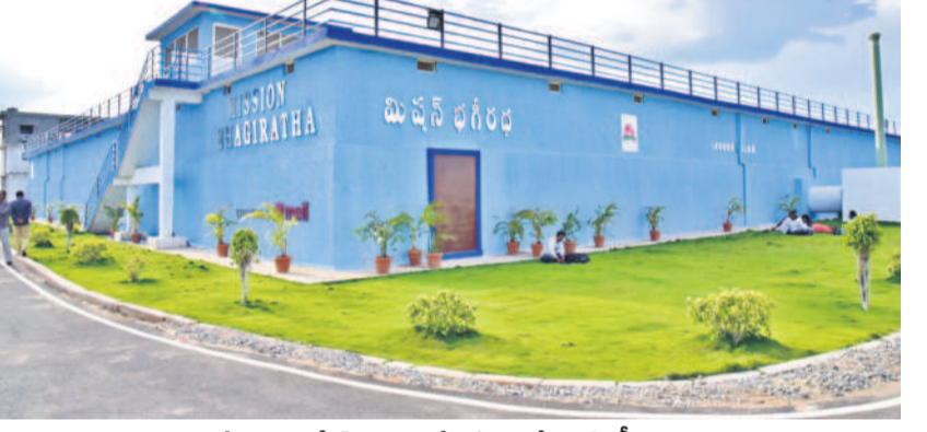
సిద్దిపేట జిల్లా గజ్వేల్ మండలం కోమటిపాటిలో మిషన్ భగీరథ సమస్య