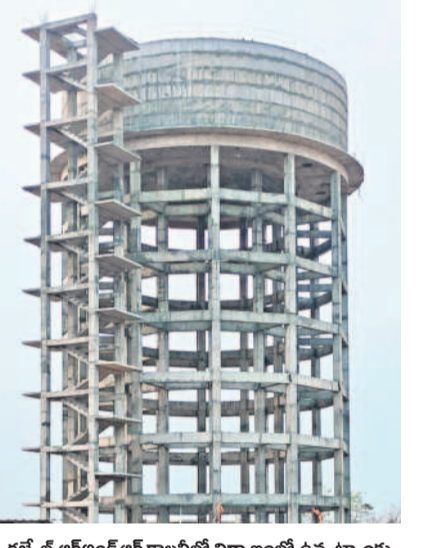
గజ్వేల్ లో అంబలికేంద్రం కాలనీలో నిర్మాణంలో ఉన్న ట్యాంకు

కాలనీలో తాగునీటి ట్యాంకు నిర్మాణంలో ఉంది. గజ్వేల్ నియోజకవర్గ పరిధిలోని చాలా గ్రామాల్లో తాగునీటి సమస్య నెలకొంది. గజ్వేల్ మండలం కోమటిపాటి కొండపాక, కుకునూరుపల్లి, తూ.ప్రాన్, మనోహరాబాద్ మండలాల్లో 178 గ్రామ పంచాయతీలు ఉన్నాయి. ఈ గ్రామాల్లో చాలా ప్రాంతం నుంచే తాగునీటి సమస్యలు మొదలయ్యాయి. గతంలో మార్దిగా మిషన్ భగీరథ సుందరి పరిపాలనలో నీళ్లు వచ్చాయి. వడలక పోవడంతో ప్రజలకు నీళ్లు సరిపోవడం లేదు. టీఆర్ఎస్ హయాంలోని సరఫరా చేసేవారు. దీంతో గ్రామాల్లోని బోర్డును వినియోగించే అవసరం లేకుండా పోయింది. దీంతో వాటి వినియోగంతో అవి పనిచేయకుండా పోయాయి. వాటిని వినియోగంలోకి తీసుకురావాలంటే నిధులు లేక పంచాయతీ కార్యదర్శులు రిలే చేయాలనే పోషణలు ఉన్నాయి. తాగునీటి సమస్యను గజ్వేల్ ప్రజల దాహర్షి మాత్రం అధికారులు తీర్చడంలో విఫలమవుతారనే విమర్శలు వినిపిస్తున్నాయి.