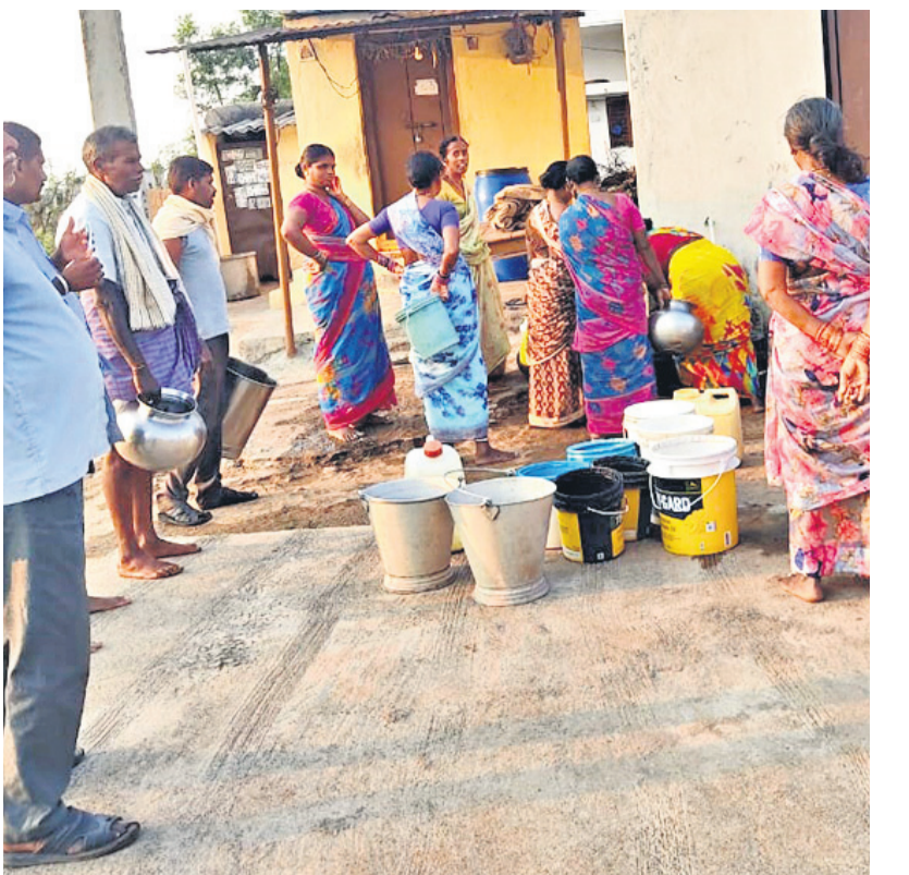
సిద్దిపేట జిల్లా కుకునూరుపల్లి మండలం లకుదారంలో బోరు వద్దనిర్మించుతున్న మహిళలు