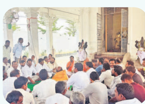
చేవెళ్ల రూరల్ : ముడిమూల గ్రామంలో..