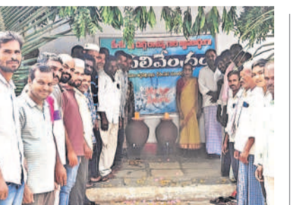
కేశవపేటలో చలివేంద్రాని ప్రారంభస్థుల గ్రామస్థులు