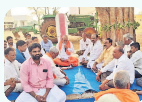
కేశవపేట: పాపిరెడ్డి గూడలో..