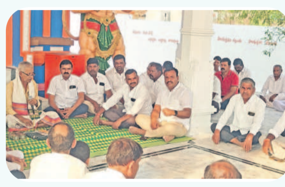
చేవెళ్ల టౌన్: పంచాంగ చదివి వినిపిస్తున్న పూజారి