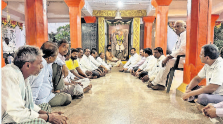
ఆమనగల్లు పట్టణంలోని అంజనేయస్వామి ఆలయంలో..