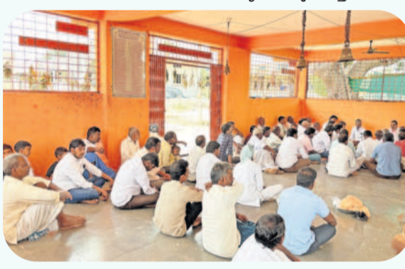
షాద్ నగర్ మండల పరిధిలోని కుమ్మరిగూడ మానుమానే దేవాలయంలో పంచాంగ శ్రవణం వింటున్న ప్రజలు