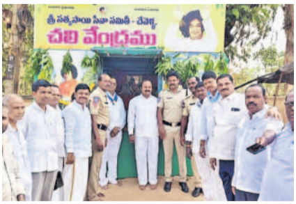
చేవెళ్లటాన్: చలివేంద్రాని ప్రారంభస్థుల సత్కారాలు సేవా సమితి సభ్యులు

మాడ్చల, మార్చి 30 : మండల పరిధిలోని నర్సాయపల్లి గ్రామ సమీపంలో మాడ్చలకు వచ్చే రోడ్డు పక్కన వ్యవసాయ పొలంలో ఉన్న కరెంట్ స్తంభం ఒకవైపు ఒరిగి కింద పడటానికి అవకాశం ఉక్కువగా ఉంది. కింద పడకుండా చిన్న రాంబు సహాయంగా పెట్టారు. కరెంట్ స్తంభం కింద పడితే పశువులు, గొర్రెలు, మేకలు, మనుషులకు కూడా ప్రమాదం జరిగే పరిస్థితి ఉంది. మాడ్చల నుంచి వచ్చే కరెంట్ స్తంభంలో దాదాపు 10 కరెంట్ స్తంభాలు ఒరిగి ఉన్నాయి. ఇప్పటికైనా విద్యుత్ అధికారులు స్పందించి వాటిని తొలగించి కొత్త స్తంభాలను ఏర్పాటు చేయాలని గ్రామస్థులు కోరుతున్నారు.