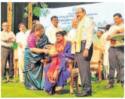
- కర్నూలు, మార్చి 30