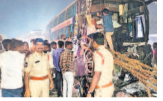
ప్రమాదంలో రెండు తిన్న ఓల్డ్ బస్సు ముందుభాగం