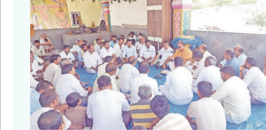
చేవెళ్ల రూరల్: రామన్నగూడలో పంచాంగ శ్రవణం పరిస్థితులు వేడితుడు