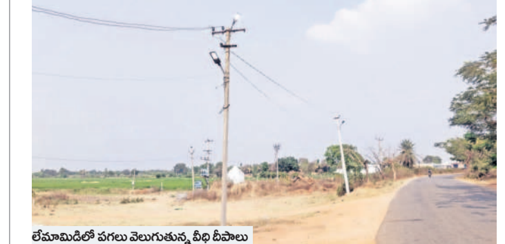
లేమామిడిలో పగలు వెలుగుతున్న వీధి దీపాలు

కేశవపేట, మార్చి 30: ప్రత్యేకాధికారుల పాలలో చర్యవేక్షణలోపం కారణంగా వీధి దీపాలు నిరంతరం పగలు కూడా వెలుగుతూనే ఉన్నాయని మండల పరిధిలోని లేమామిడి గ్రామ ప్రజలు చెబుతున్నారు. వీధి దీపాలను ఆన్ చేయడం, బండ్ల చేయడం ఎందుకు అనుకున్నారో? ఏమో తెలియదానీ పగలు, రాత్రి అనే తేడా లేకుండా వెలుగుతున్నా ఎవరూ పట్టించుకోవడంలేదని స్థానికులు చెబుతున్నారు. విద్యుత్తును వ్యధా చేయడం ద్వారా అమర్ లిఫ్ట్ వీధి దీపాలకు ఆన్ అఫ్ సౌకర్యం ఏర్పాటు చేసి ఉదయం పూట బండ్ల చేసే సాయంత్రం సమయంలో వేయాలని గ్రామస్థులు కోరుతున్నారు.