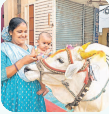
షాద్ నగర్ లో గోమాతకు పూజలు చేస్తున్న మహిళ

ఆలయాల్లో పంచాంగ శ్రవణం వినిపించిన పురోహితులు విశ్వావసు నామ సంవత్సరానికి స్వాగతం పలికిన ప్రజలు