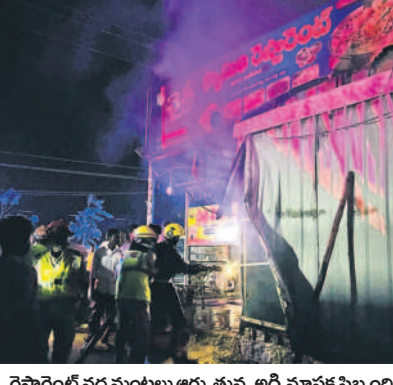
రెస్టారెంట్ వద్ద మంటలు అగ్ని తున్న అగ్నిమాచక సిబ్బంది

ఆమనగల్లు, మార్చి 30: ఆమనగల్లు పట్టణంలోని చైతన్య రెస్టారెంట్ లో ఆదివారం రాత్రి అగ్ని ప్రమాదం సంభవించింది. ఒక్కసారిగా మంటలు చెలరేగడంతో స్థానికులు గమనించి పోలీసులకు సమాచారం చేరవేశారు. ఎన్ఫై వెంటనే తన సిబ్బందితో ఘటనా స్థలానికి చేరుకుని మంటలను ఆర్థి ప్రయత్నం చేస్తూ కల్వకుర్తిలోని అగ్ని మాచక కేంద్రానికి సమాచారం అందించారు. అగ్నిమాచక సిబ్బంది అక్కడికి చేరుకొని మంటలను ఆర్థివేశారు. విద్యుద్దాహంతో అగ్ని ప్రమాదం సంభవించి ఉంటుందని పోలీసులు భావిస్తున్నారు. ఇందులో ఎలాంటి ప్రాణనష్టం జరగలేదు. ఫర్నిచర్ ఇతర వస్తువులు పూర్తిగా అగ్నికి ఆహారీ అయినట్లు ఎన్ఫై తెలిపారు.