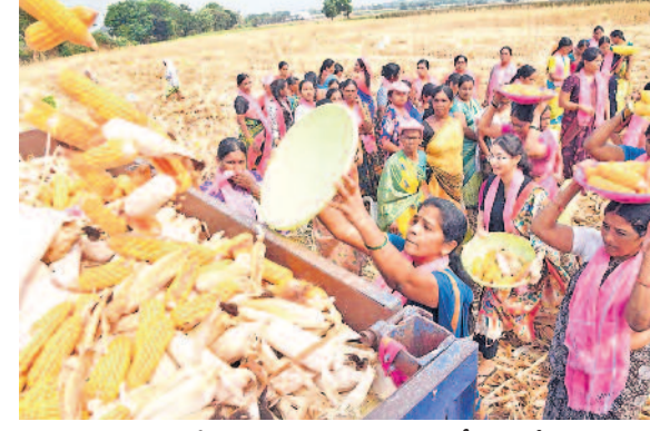
సిద్దిపేట జిల్లా బెజ్జంకి మండలం లక్ష్మీపూర్ లో మక్క చేసినలో కూలి పని చేస్తున్న బీఆర్ఎస్ మహిళా నాయకులు

బీఆర్ఎస్ రజతోత్సవ సభ కోసం పాలం పనులు! సిద్దిపేట, మార్చి 31 (నమస్తే తెలంగాణ ప్రతినిధి): బీఆర్ఎస్ రజతోత్సవ సభకు తరలివెళ్లెందుకు పార్టీ అభిమానులు, కార్యకర్తలు వినుత్తు రీతిలో సిద్దిపేటకువచ్చారు. ఈ నెల 27న హనుమకొండ జిల్లా ఎల్లూరులో నిర్వహించనున్న భారీ బహురంగ సభకు తరలి వెళ్లెందుకు ఉత్సాహం చూపుతున్న మహిళలు ఎవరి తోవ్వ బుర్గులు వారే సమకూర్చుకుంటున్న దృశ్యం సిద్దిపేట జిల్లాలో కనిపిస్తున్నది. సోమవారం సిద్దిపేట జిల్లా మానకొండలో నియోజకవర్గం బెజ్జంకి మండలం లక్ష్మీపూర్ గ్రామంలో బీఆర్ఎస్ పార్టీ మహిళా నేతలు, మాజీ మహిళా ప్రజాప్రతినిధులు > 8వ పేజీలో