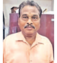
ఫోటోగ్రాఫర్ వెంకటేశ్వర్లు తామ్మిడి యూనివర్సిటీ

గతంలో ప్రభుత్వం అన్ని ఆలోచించి ఉన్నత విద్యార్థులకు భూ కేటాయింపుల చేశాయి. దానిని తిరగకోడి, ఆ భూములను తిరిగి ప్రభుత్వం స్వాధీనం చేసుకుని రియల్ ఎస్టేట్ రంగానికి కట్ట పెట్టాలనుకోవడం దుర్మార్గం. రాష్ట్ర ప్రభుత్వం ఇకనైనా ఆలోచించి వర్షిలో భూముల అమ్మకాన్ని నిలిపివేయాలి. అభివృద్ధి చేయాలంటే ప్రభుత్వం ఇతర ప్రాంతాల్లో భూములు సేకరించాలి. దేశాన్ని కొల్లగొట్టాలంటే విద్యార్థులను మూసివేయాలని ఆలోచనలో కాంగ్రెస్ ప్రభుత్వం ఉన్నది. హైదరాబాద్ సెంట్రల్ విశ్వవిద్యాలయంలో ఉన్న జీవ వైవిధ్యాన్ని దెబ్బతీయడం దారుణం. పర్యావరణ సమతుల్యతతో మానవజాతి వివాహానికే మార్గాలు ఏర్పడుతాయి. ఇకనైనా ప్రభుత్వం ఆలోచించి భూములు లాక్సిన్ నిర్ణయాన్ని వాయిదా వేసుకోవాలి.