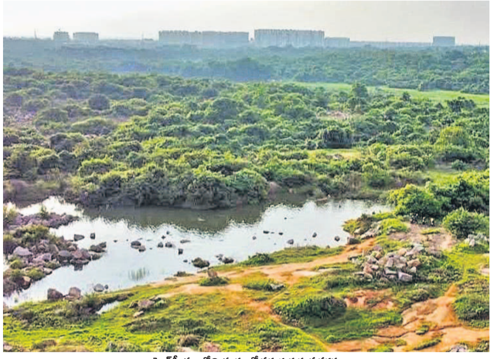
హెచ్సీయూలోని భూముల్లో పరుచుకున్న పచ్చదనం