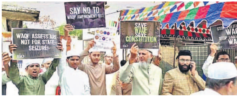
హైదరాబాద్, మార్చి 31: వడ్డీ బోర్డు సవరణ బిల్లు ప్రతిఘటనలో పాల్గొన్న వారిలో ప్రధానమందిన వలుపురు ముస్లింల ఆందోళన వ్యక్తం చేశారు. హైదరాబాద్ ఉజాల-షా ఈర్ష్యా మైదానంలో రంజాన్ ప్రార్థనల సందర్భంగా ముస్లిం సోదరులు నల్ల బ్యాడ్జిలు ధరించి ప్రార్థనలకు హాజరయ్యారు. అనంతరం బిల్లుకు వ్యతిరేకంగా నిరసన తెలిపారు. ఈర్ష్యా సమీపంలో ఘోషాధ్వజాలతో నిరసన తెలిపారు. వలుపురు ఇస్లాం మత పెద్దలతో బిల్లుకు వ్యతిరేకంగా వారం రోజులుగా సగరవ్యూహం శాంతియుత ఆందోళనలు నిర్వహిస్తున్నట్లు పేర్కొన్నారు.