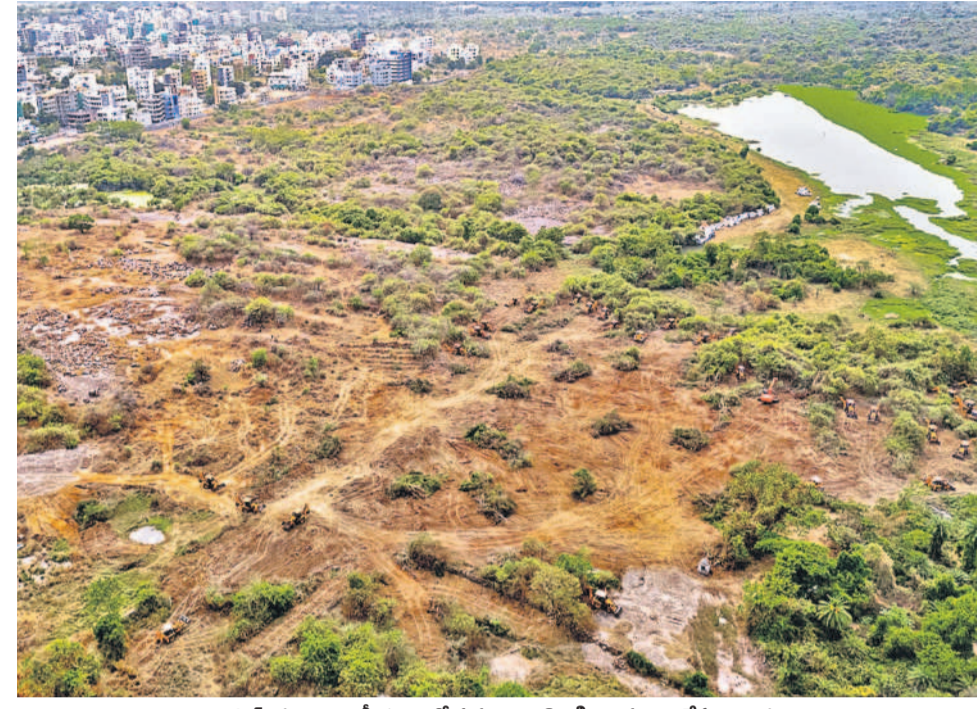
సెంట్రల్ యూనివర్సిటీ భూముల్లో పచ్చదనాన్ని తొలగించి చదును చేస్తున్న దృశ్యం