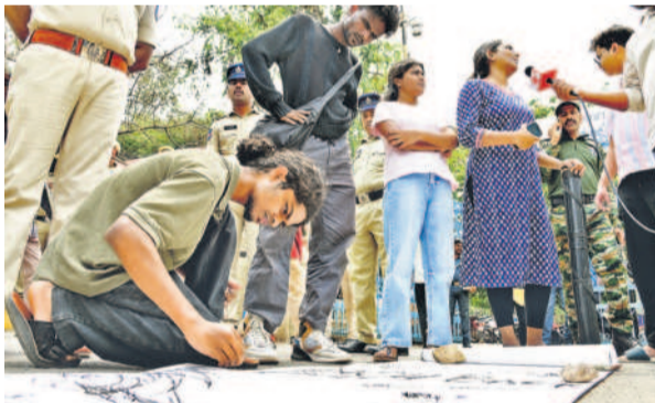
యానివర్సల్ వైవిధ్యాన్ని వర్ణిస్తూ బిట్రాలు వేస్తున్న విద్యార్థులు

వందలాది జింకలు, నెమళ్లు, కుండేళ్లు, ఇతర వన్యప్రాణులకు ఆవాసమైన ఈ భూముల్లో నిత్యం సంరక్షనానే ఉంటాయి. చిరుజల్లుల మొదలైనప్పుడు, వేసవి తాపాన్ని తట్టుకునేందుకు క్యాంపస్ ప్రాంగణంలో తిరుగుకుంటూయని విద్యార్థులు పెట్టొచ్చారు. కానీ ప్రభుత్వం మాత్రం టీజీఐఎస్ భూములకు సమీపంలో ఎక్కడా కూడా వన్యప్రాణుల సంవారం లేదని వాదిస్తోంది. అదివారం రాత్రి చేపట్టిన లెవలింగ్ పనులతో ఇబ్బందికి గురైన వన్యప్రాణుల హాళికారాలు సోషల్ మీడియాలో చక్కర్లు కొడుతూనే ఉన్నాయి. దూసుకుపోతున్న బుల్డోజర్ తమ ప్రాణాలకు ప్రమాదం పొంది ఉందనీ మూగజీవాలు గజగజ వణుకుతున్నాయి. ప్రభుత్వం మాత్రం ఆ భూములను రాక్షసేందుకు ఉన్నది లేనట్లుగా.. లేనిది ఉన్నట్లుగా ప్రకటనలు చేసి వన్యప్రాణులను అరిగోసే పెడుతోందని పర్యావరణ వేత్తలు ఆందోళన వ్యక్తం చేస్తున్నారు.