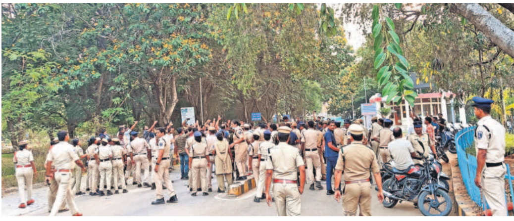
యానివర్సల్ ప్రాంగణంలో మోహరించిన వందలాది మంది పోలీసులు