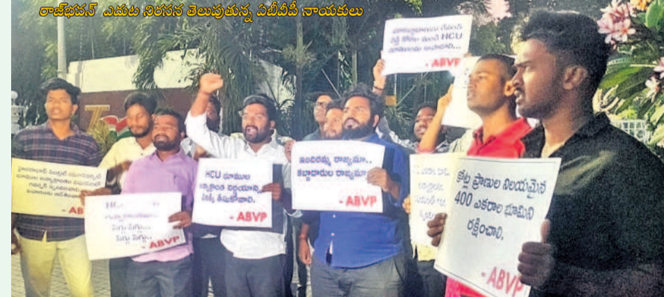
రాజీభవన్ ఎదుట నిరసన తెలుపుతున్న ఏటివీపీ నాయకులు