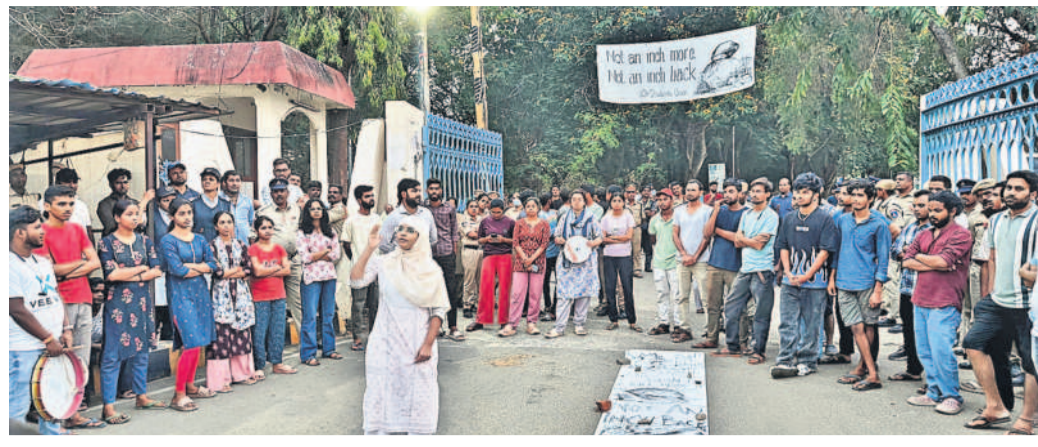
పోలీసుల దమన కాండను నిరసిస్తూ నినాదాలు చేస్తున్న విద్యార్థులు