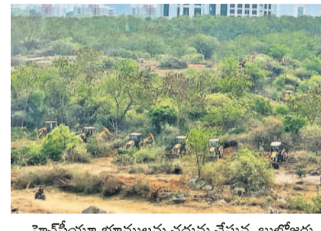
హెచ్సీయా భూములను చదును చేస్తున్న బుల్డోజర్లు