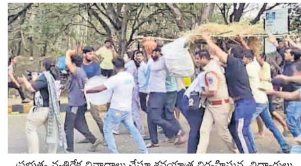
ప్రభుత్వ వ్యతిరేక నినాదాలు చేస్తూ శవయాత్ర నిర్వహిస్తున్న విద్యార్థులు